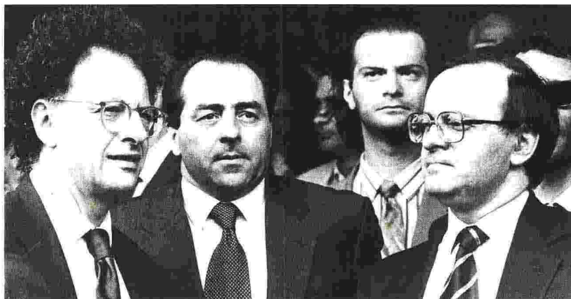
Al tempi del pool Piercamillo Davigo, a destra, ai tempi del pool che condusse l'inchiesta di Mani pulite: al suo fianco c'è Antonio Di Pietro, a sinistra Gherardo Colombo