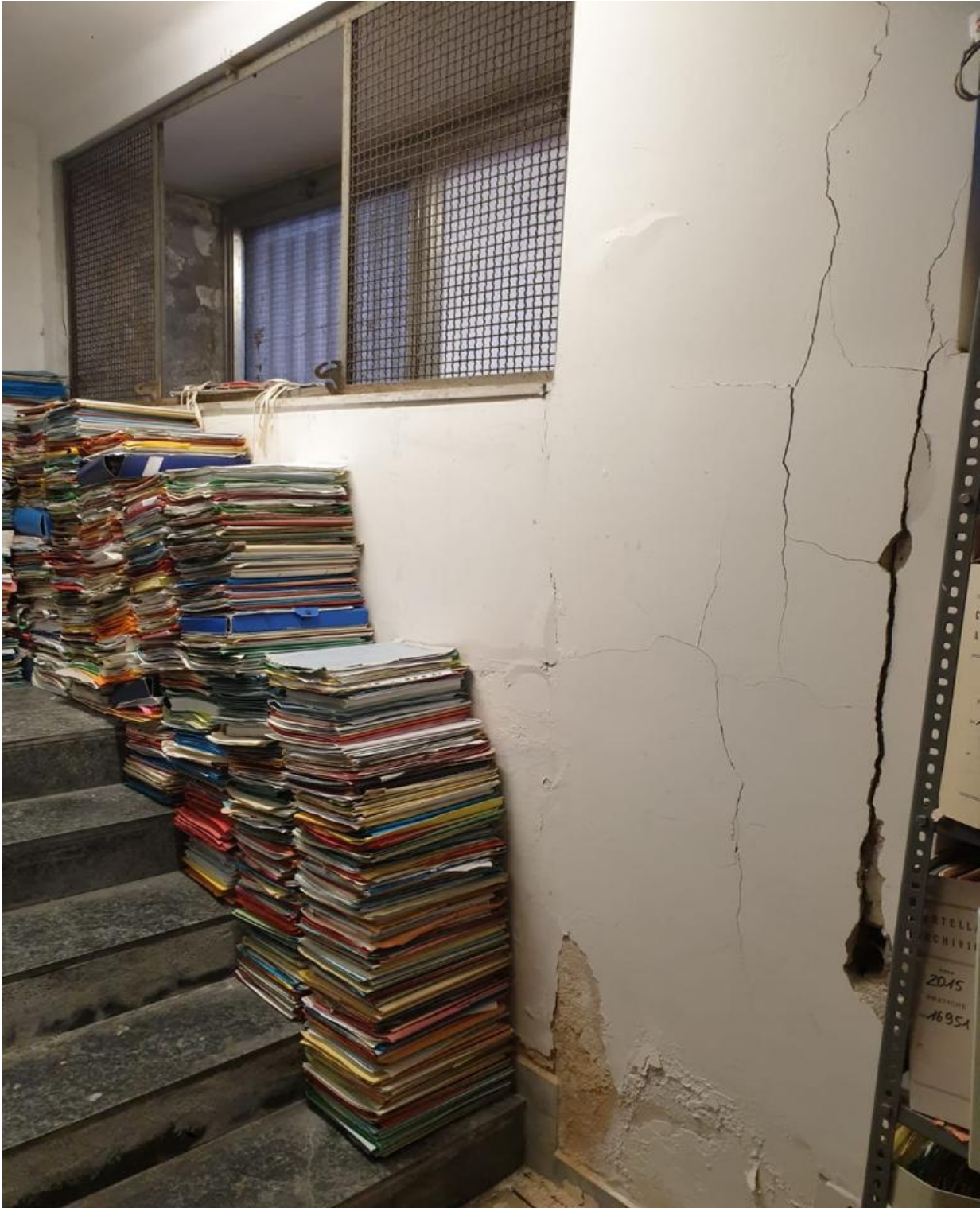
(Fig. 33, piano interrato; particolare delle crepe sul muro dell'archivio del piano interrato dove sono presenti muffe diffuse)