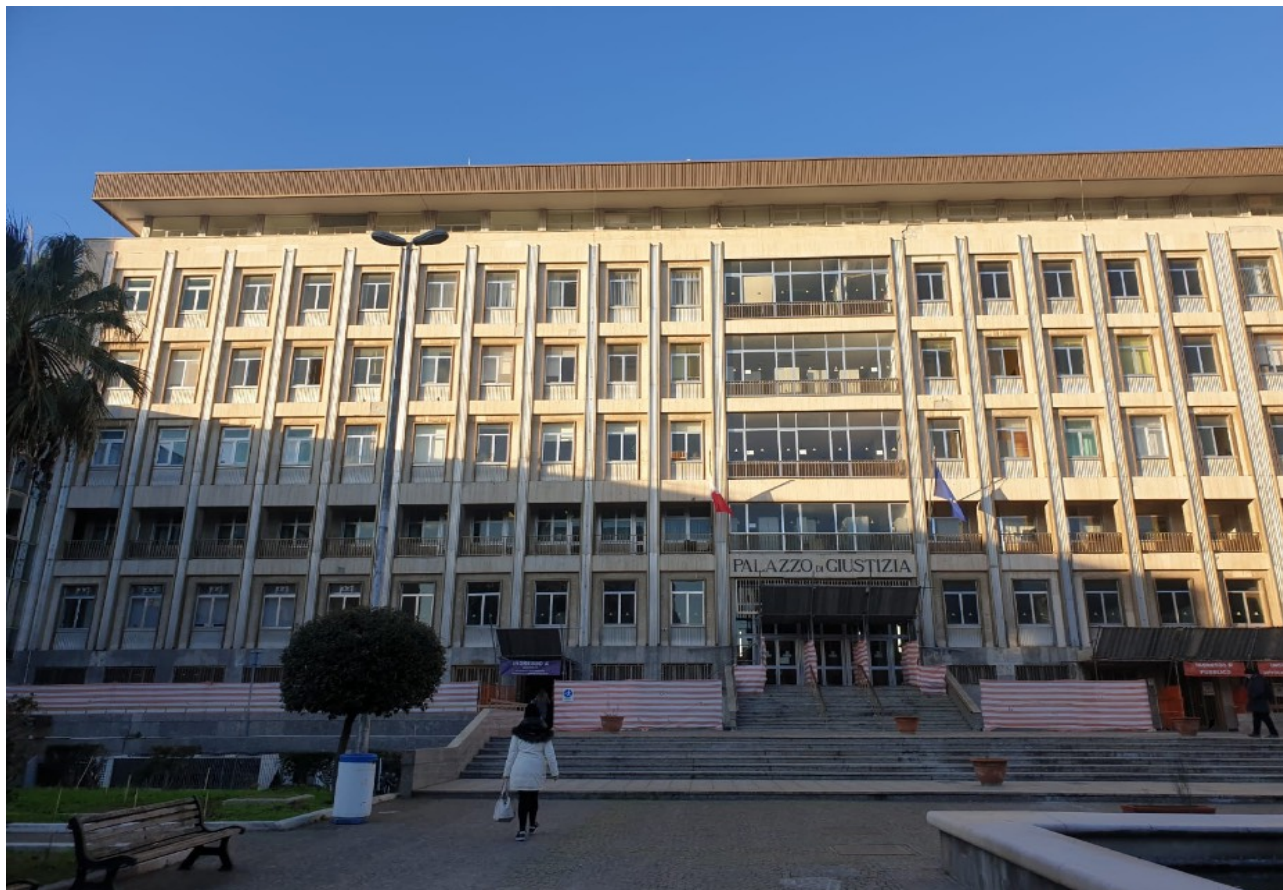
(Fig. 1, Cortile d'ingresso)