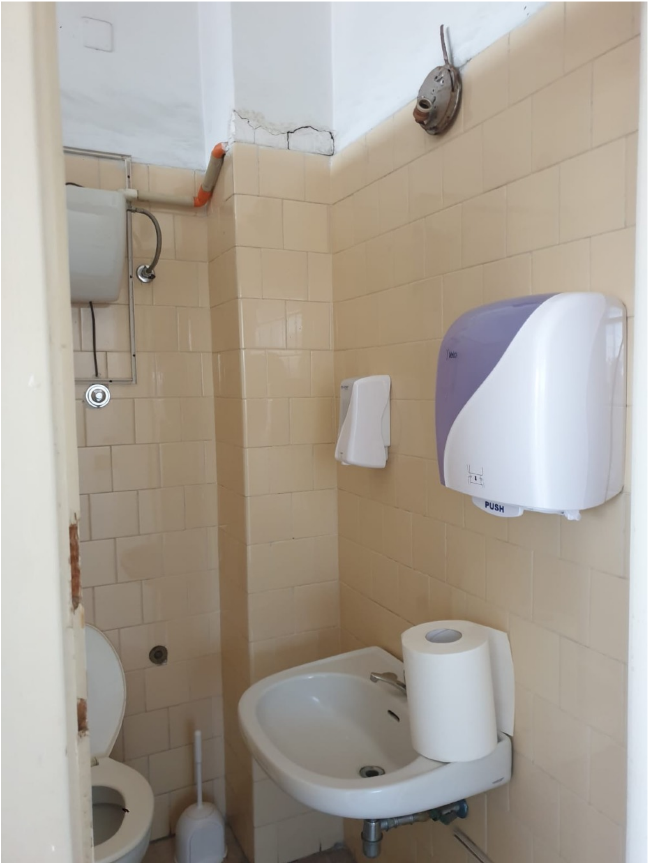
(Fig. 13, 5 piano; particolare del bagno della terza sezione civile)