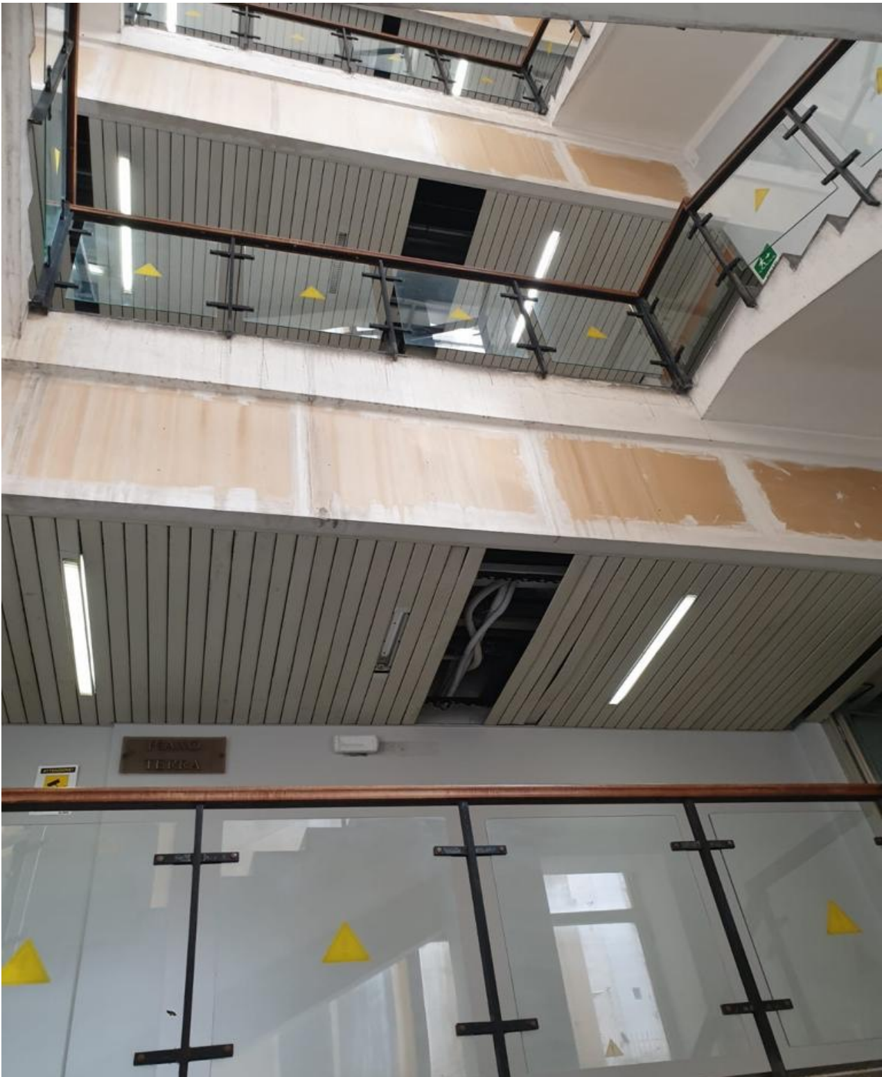
(Fig. 27, particolari dei corridoi e della soffitto delle scale poste tra secondo e terzo piano lato Procura Generale e Corte di Appello)