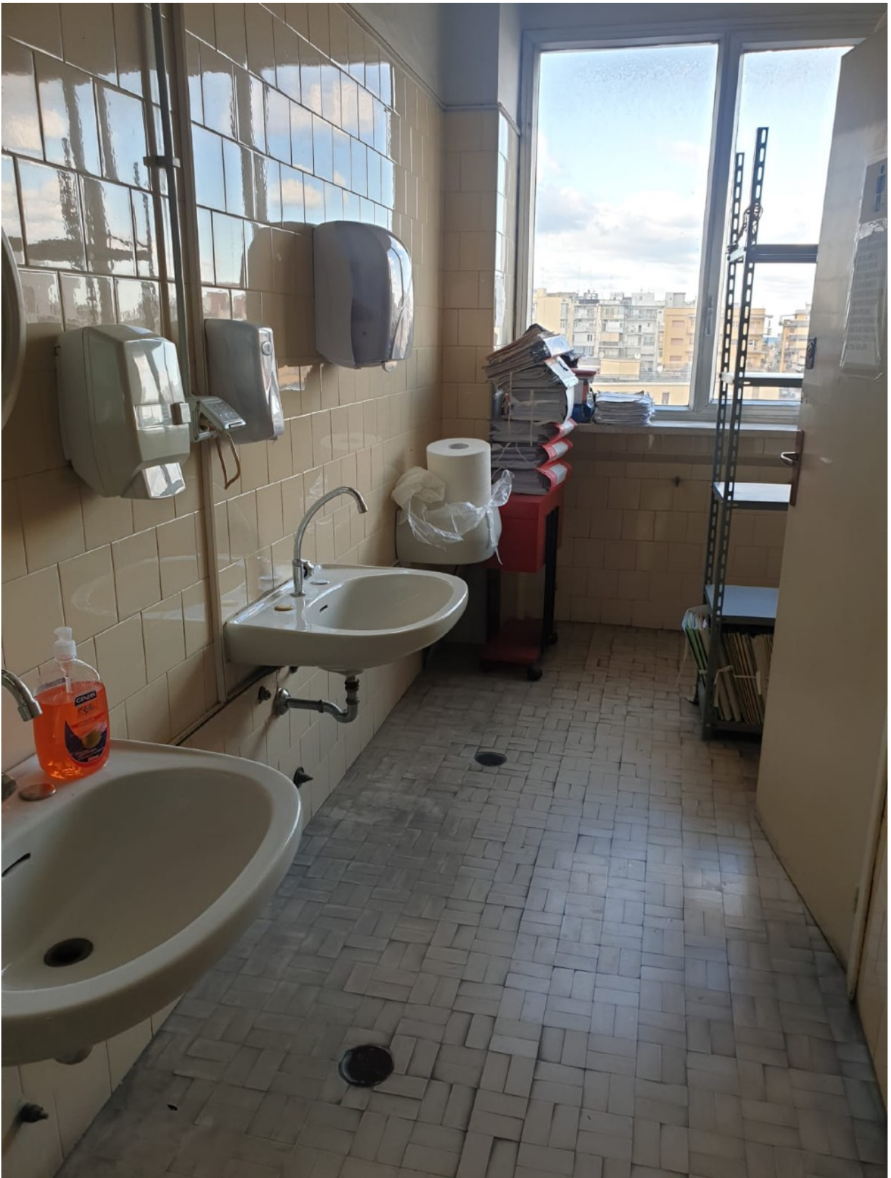
(Fig. 11, Quinto piano; bagno/archivio della cancelleria della terza sezione civile)