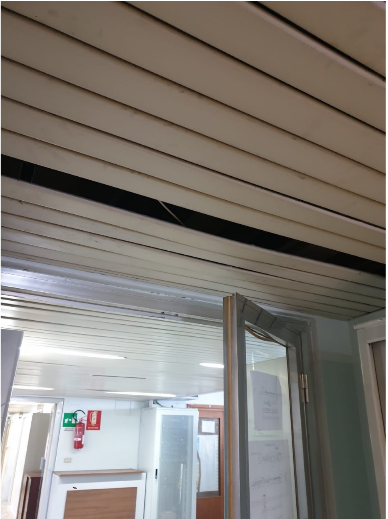
(Fig. 10, Quinto piano; particolare soffitto del corridoio delle cancellerie delle sezioni civili )