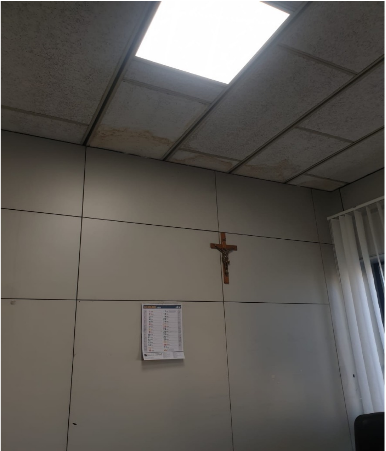
(Fig. 21, 5 piano; particolare del soffitto dell'ufficio del direttore della sezione fallimentare con evidenti e diffuse macchie di umidità)