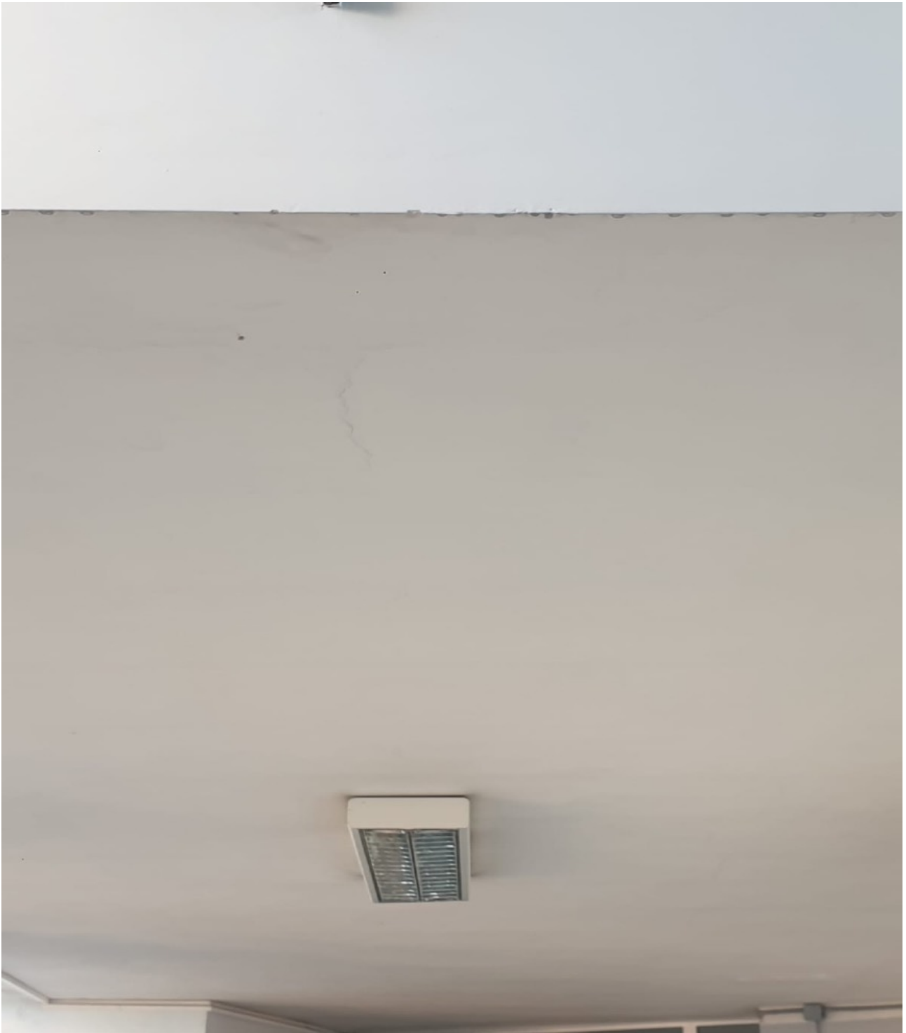
(Fig. 18, 5 piano; particolare soffitto del corridoio con evidenti e diffuse lesioni)