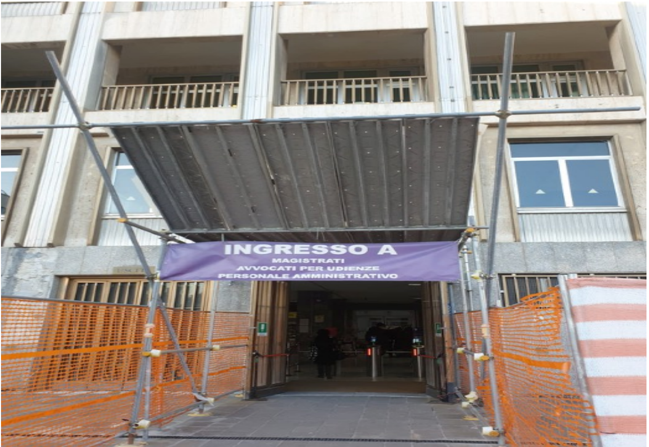
(Fig. 6, Ingresso "A" Tribunale )