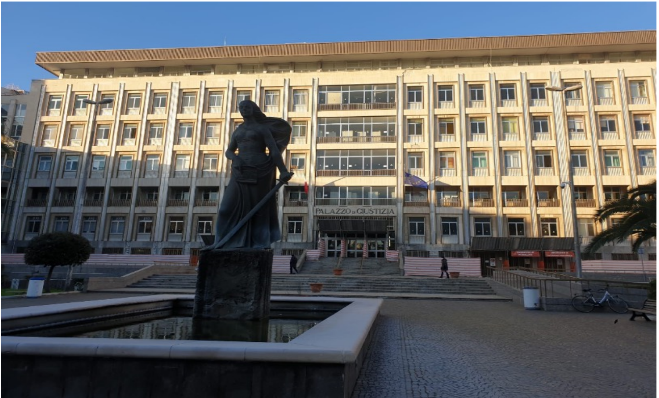
(Fig. 2, Cortile d'ingresso Tribunale Piazza E. De Nicola)