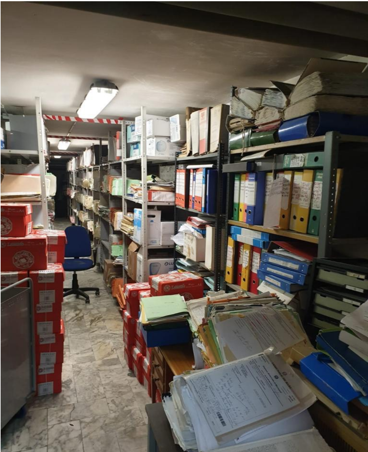
(Fig. 28, piano interrato; archivio)