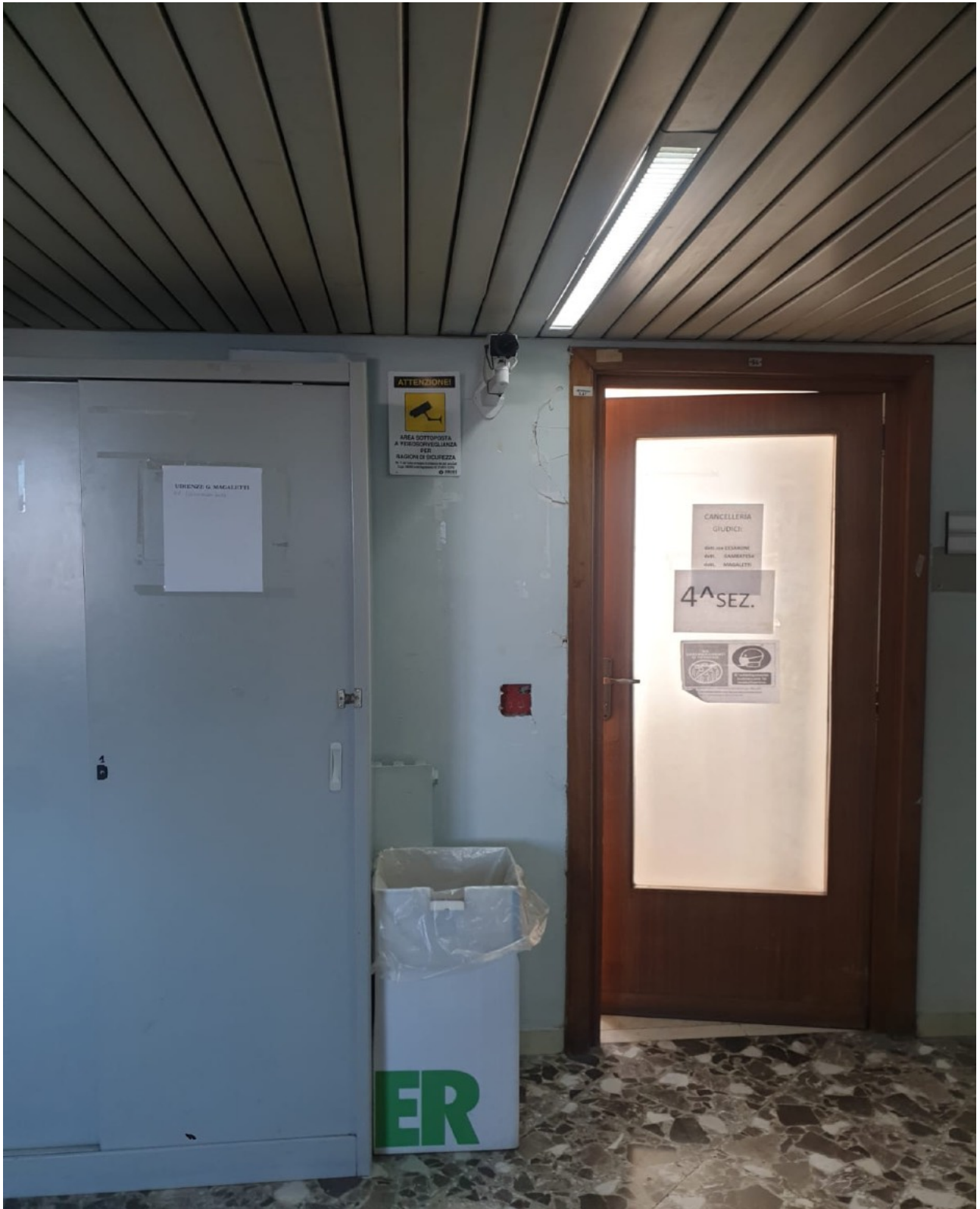
(Fig. 8, Quinto piano; ingresso corridoio delle cancellerie delle sezioni civili, particolari di lesioni diffuse sul muro)