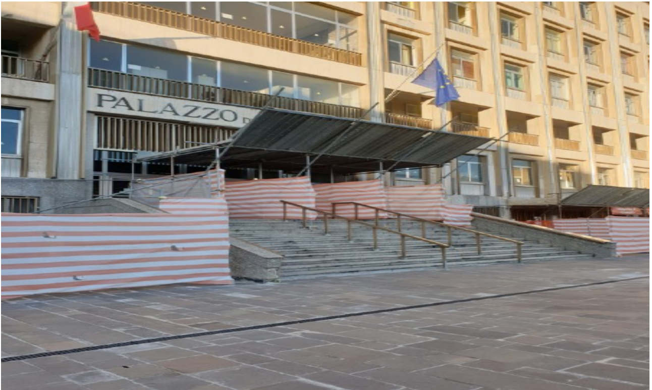
(Fig. 4, Ingresso principale Tribunale Piazza E. De Nicola)