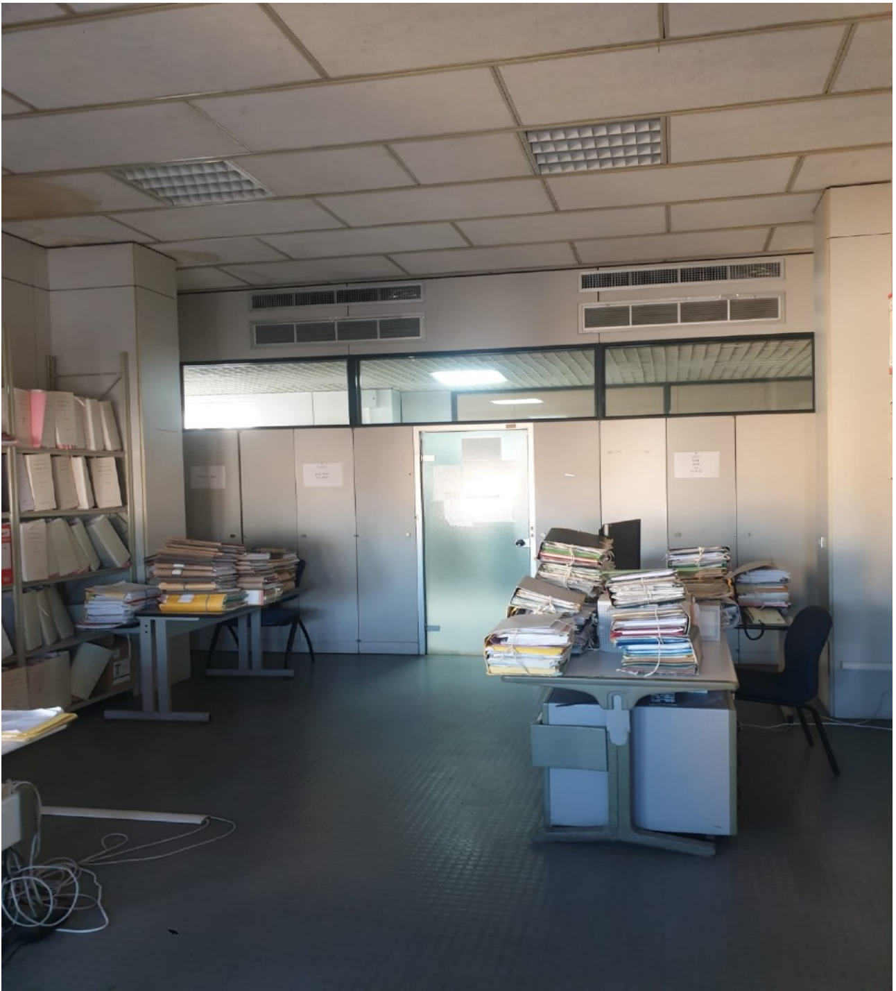
(Fig. 19, quinto piano: archivio della sezione fallimentare e tribunale delle imprese dove i fascicoli vengono posizionati in maniera precaria per mancanza di scaffalature)