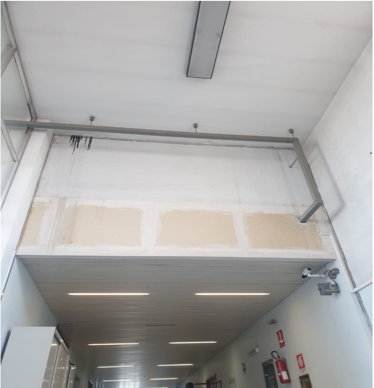
(Fig. 17, 5 piano; particolare del corridoio)