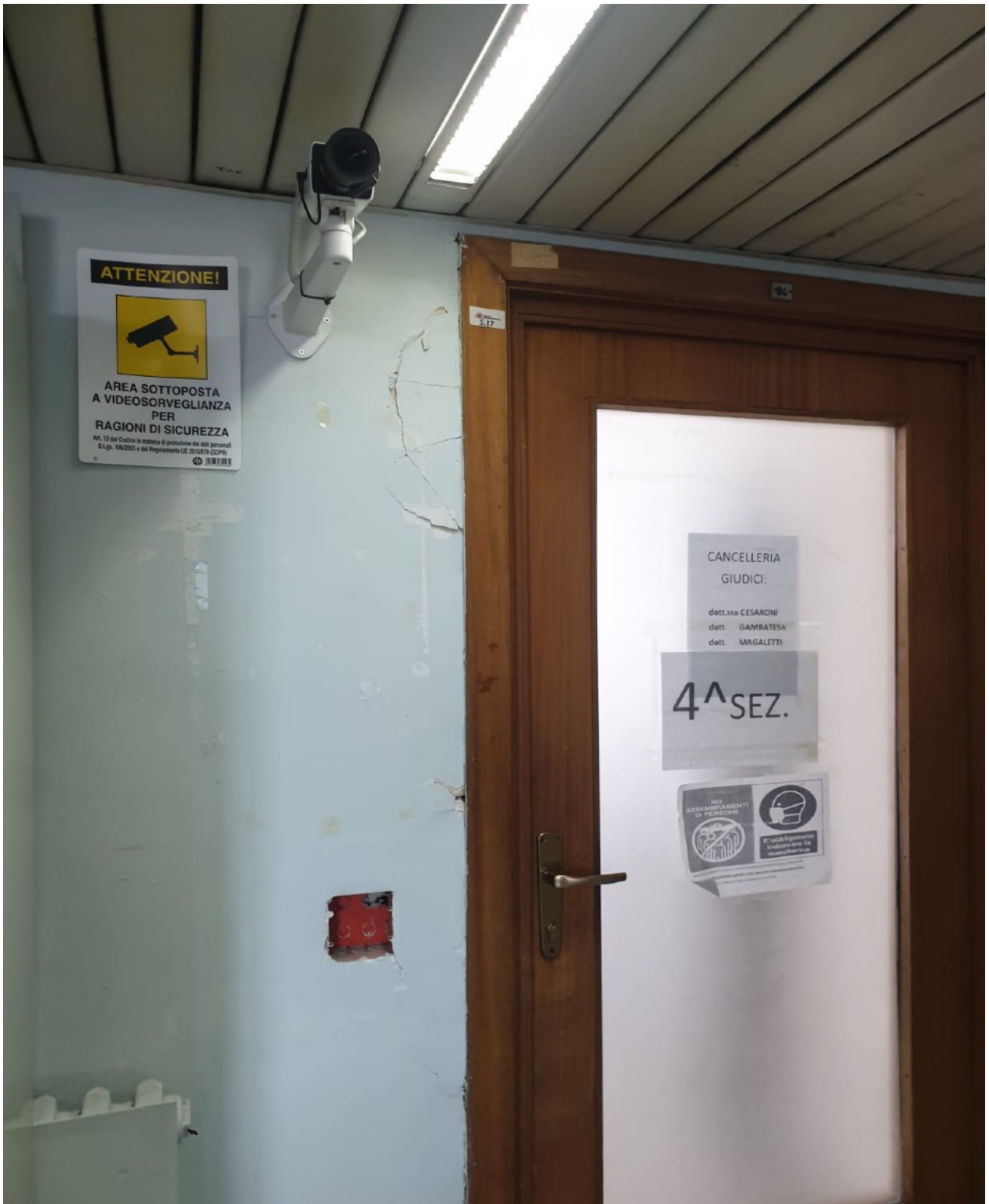
(Fig. 9, Quinto piano)