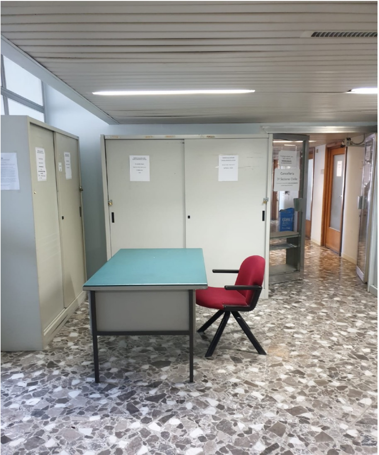
(Fig. 7, Quinto piano; ingresso corridoio della Terza Sezione Civile)