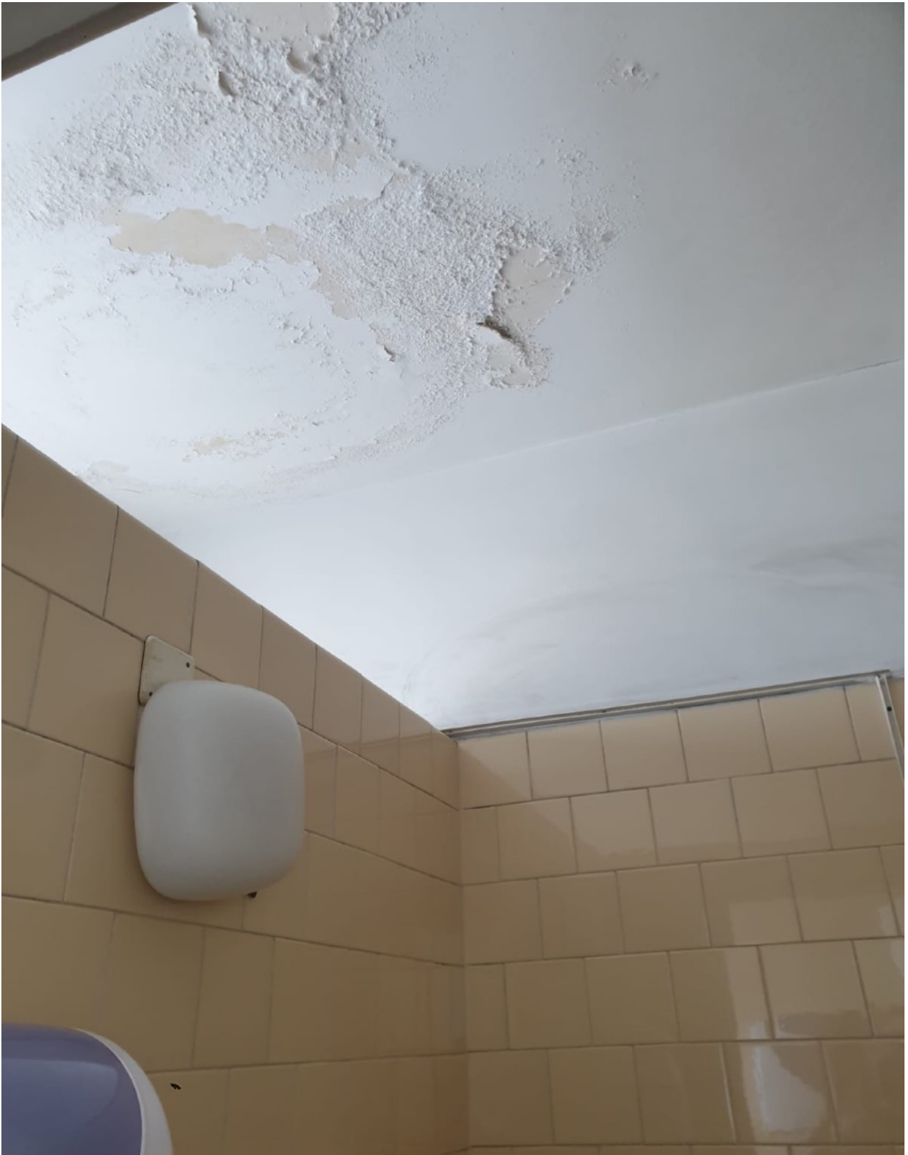
(Fig. 14, 5 piano; particolare del soffitto del bagno della terza sezione)