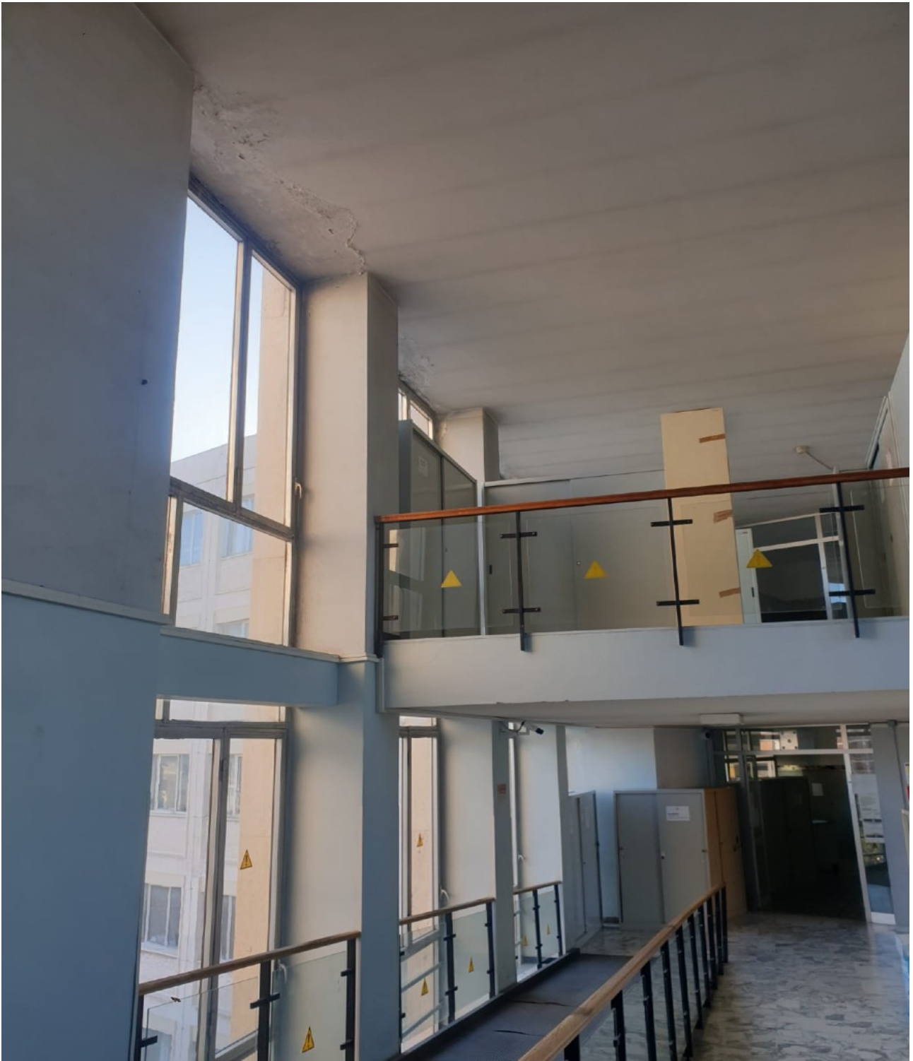
(Fig. 15, Quinto piano; corridoio dove sono evidenti lesioni strutturali e macchie diffuse di umidità)