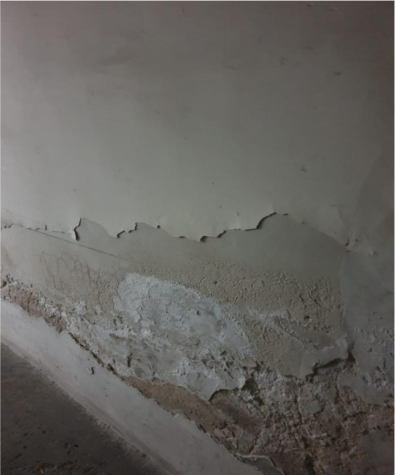
(Fig. 34, piano interrato; particolare del muro)