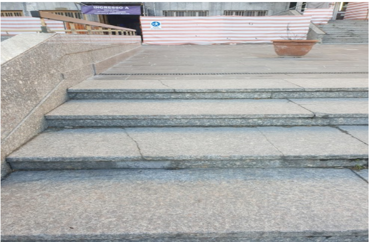
(Fig. 5 Gradini di ingresso oggetto di recente rifacimento)