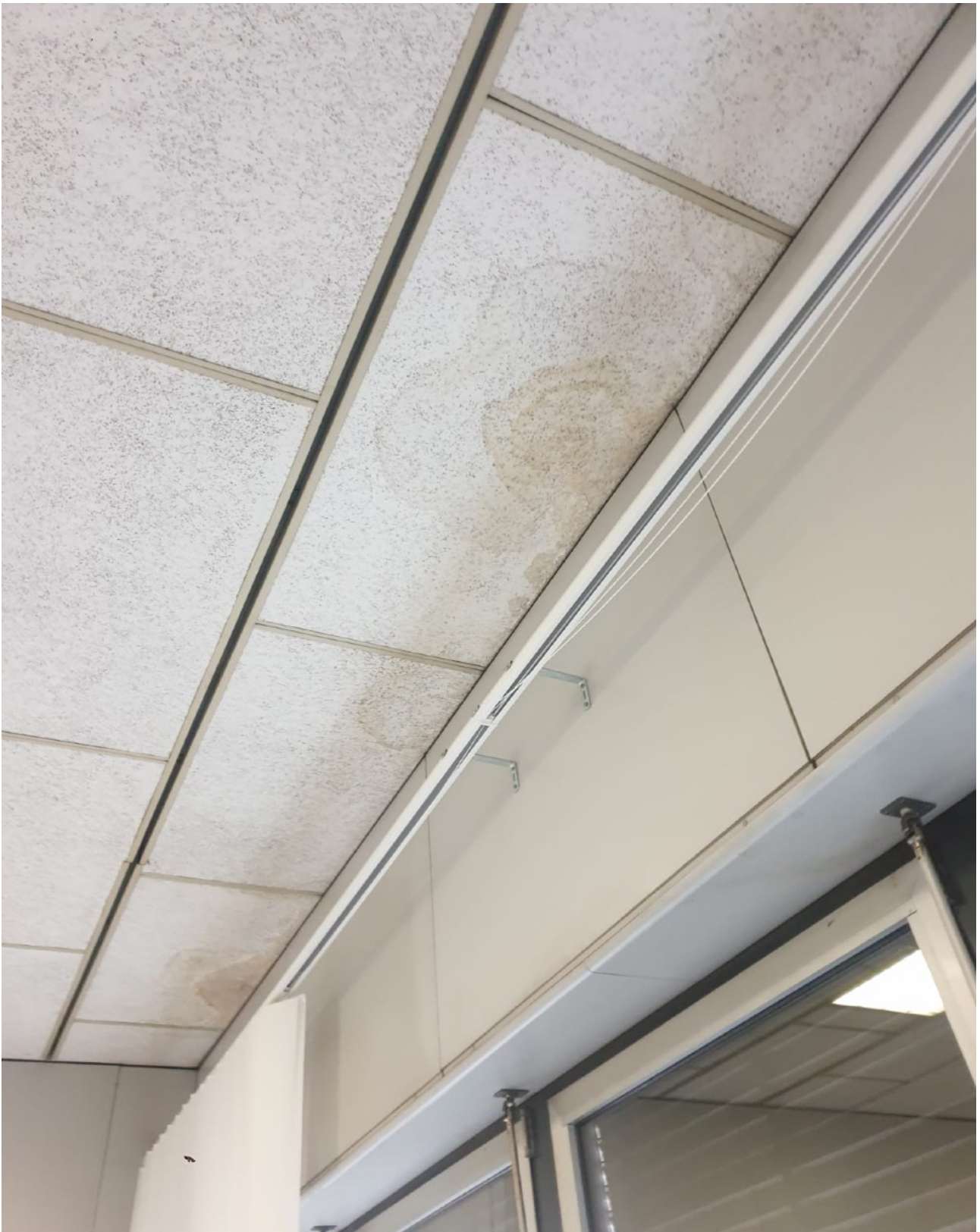
(Fig. 20, 5 piano; particolare del soffitto delle cancellerie )