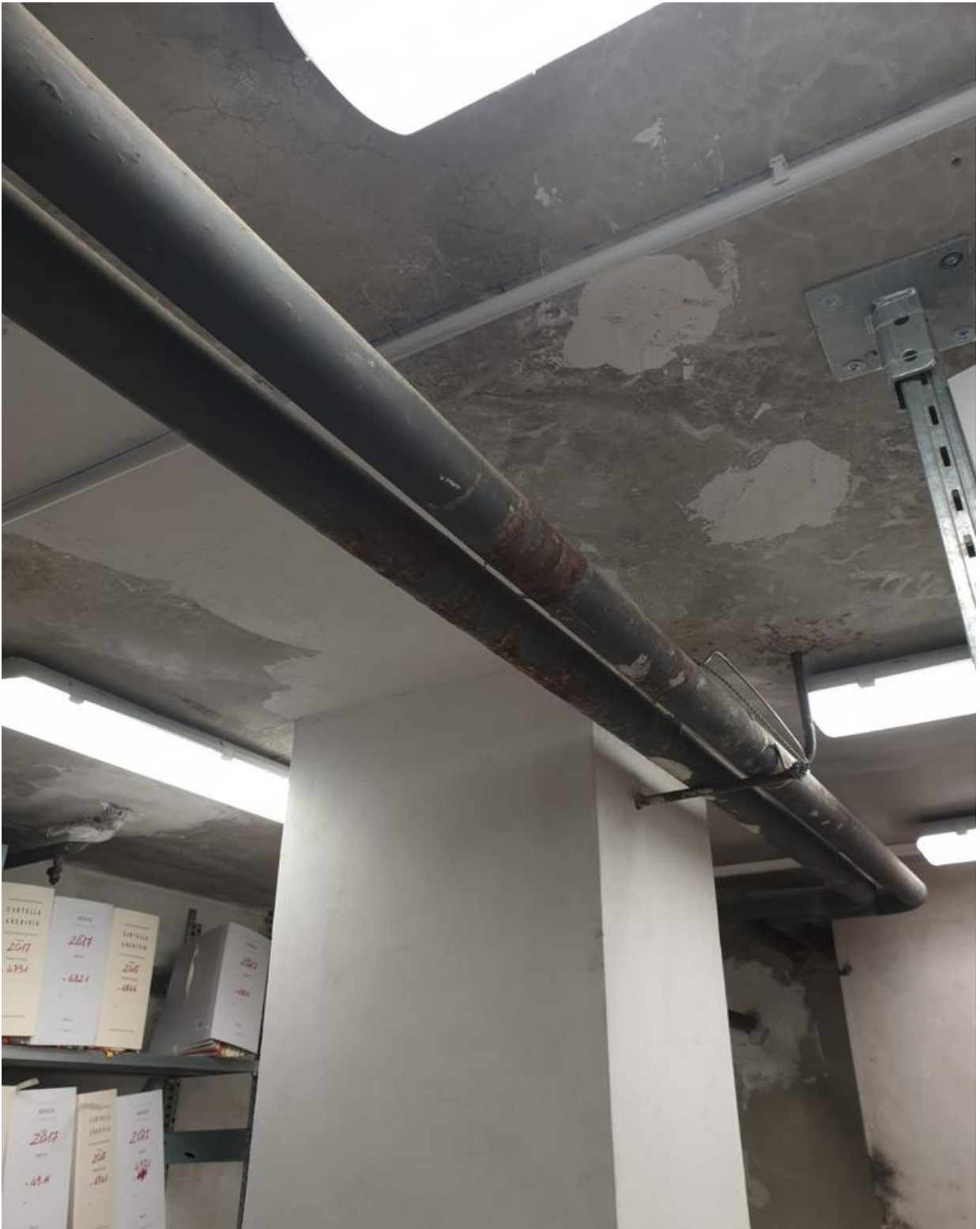
(Fig. 32, piano interrato; particolare delle tubature e dello stato del soffitto dell'archivio)