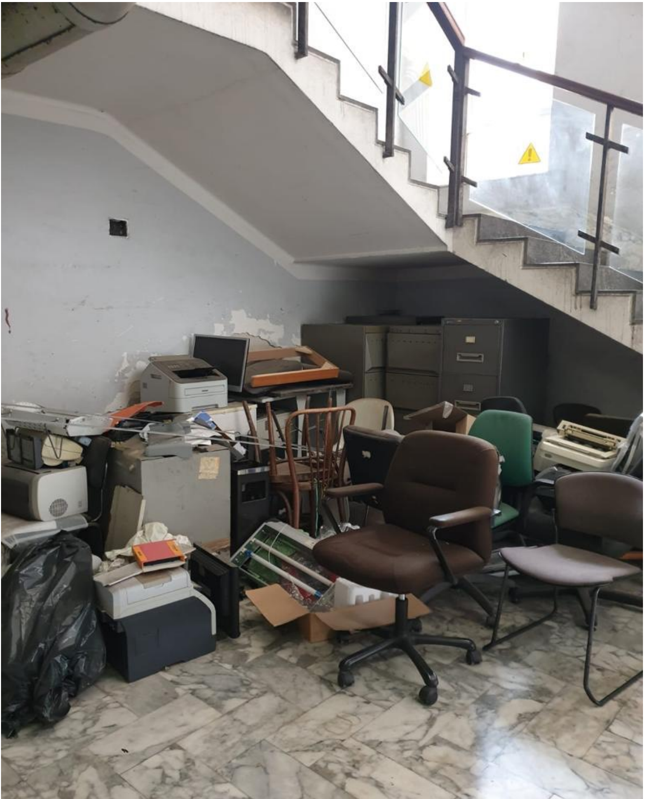
(Fig. 24, piano terra; particolare del sottoscala)