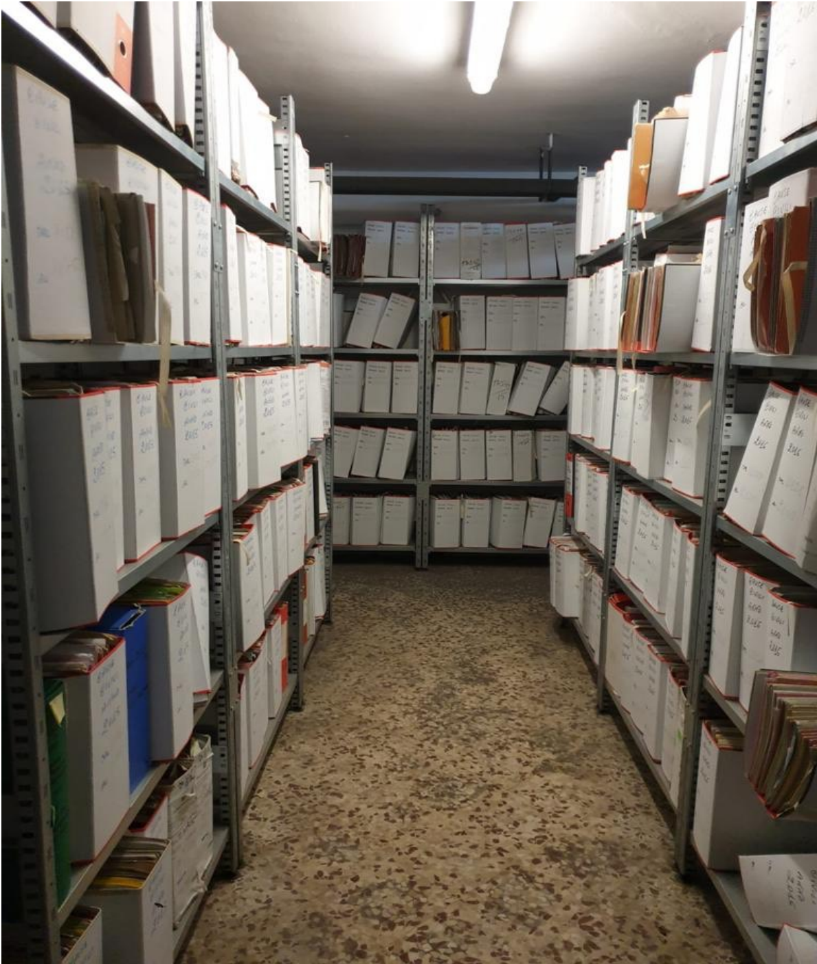
(Fig. 29, piano interrato; archivio)