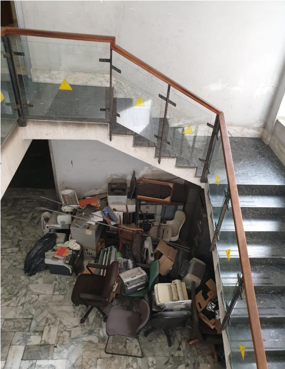
(Fig. 23, piano terra; particolare del sottoscala)