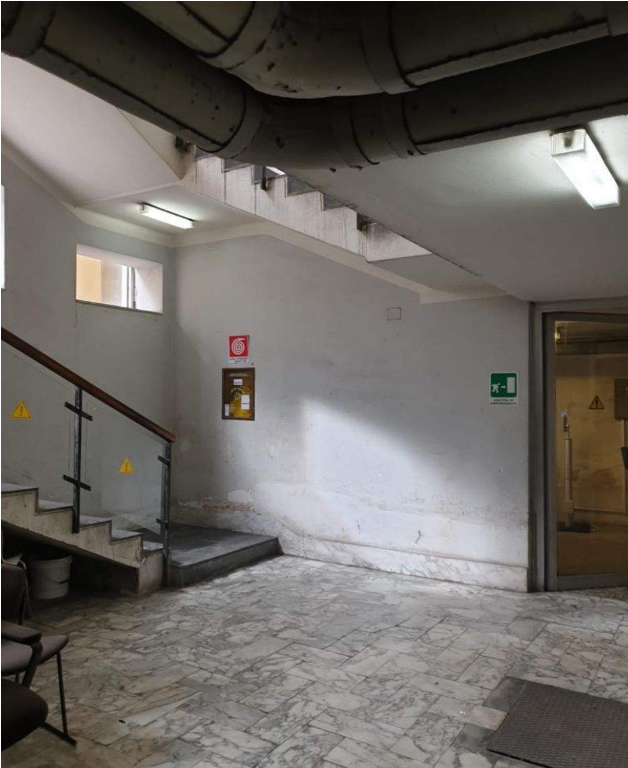
(Fig. 25, piano interrato)