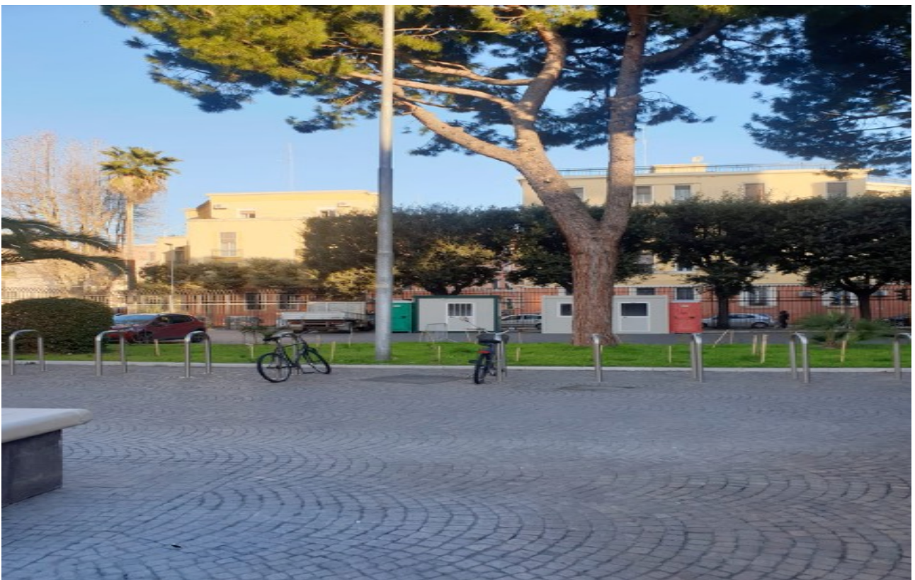
(Fig. 3, Cortile d'ingresso Tribunale lato via Crispi interessato da recenti lavori di rifacimento del basolato, interrotti per inadempimenti della impresa esecutrice)