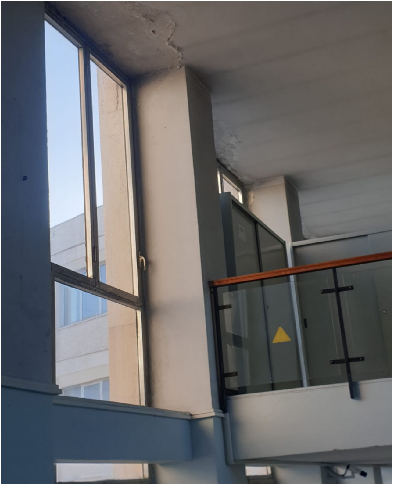
(Fig. 16, 5 piano; particolare del corridoio)