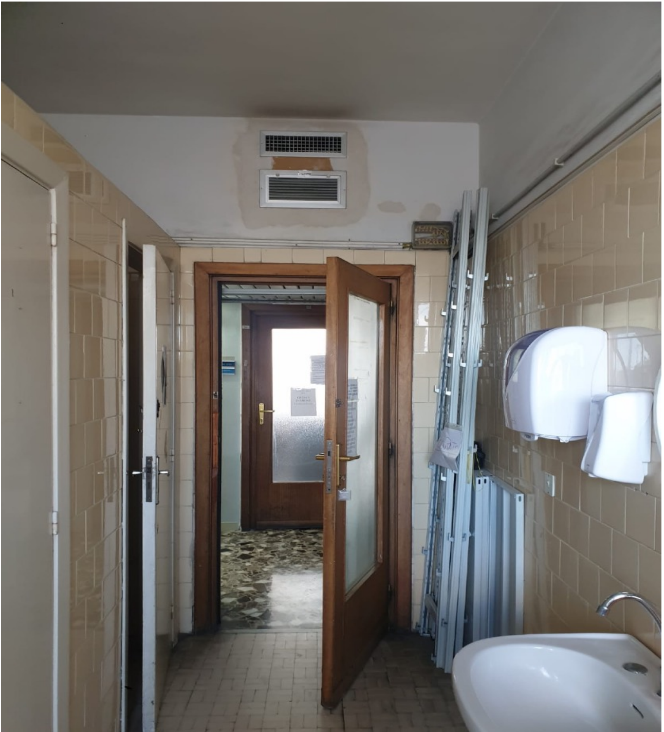
(Fig. 12, 5 piano; particolare del bagno della terza sezione civile)