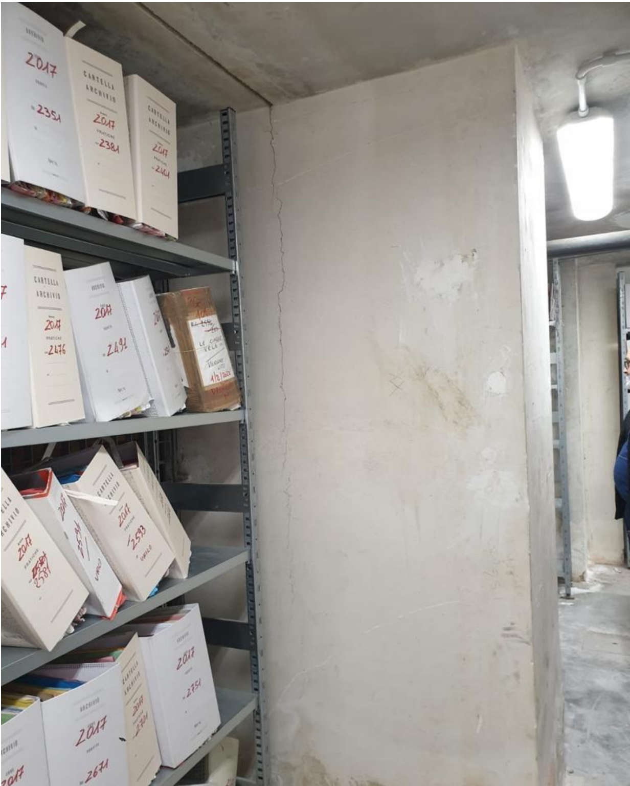
(Fig. 35, piano interrato; particolare delle crepe sul muro)