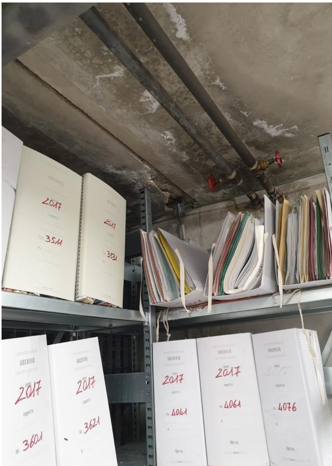
(Fig. 31, piano interrato; particolare del soffitto dell'archivio)