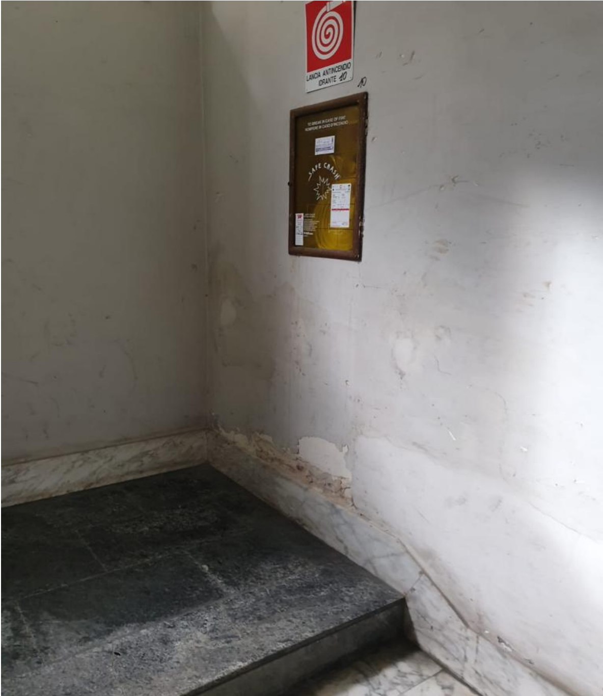
(Fig. 22, primo piano, particolare del pianerottolo intermedio con il secondo piano)