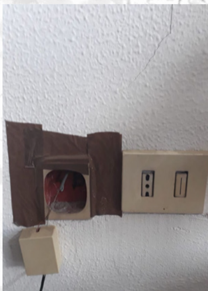
Procura di Roma stanza di Pubblico Ministero