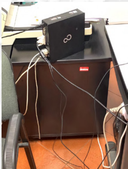
Procura di Nola stanza di Pubblico Ministero