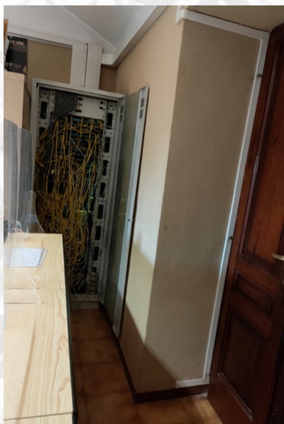
Tribunale di Biella disimpegno aula GUP