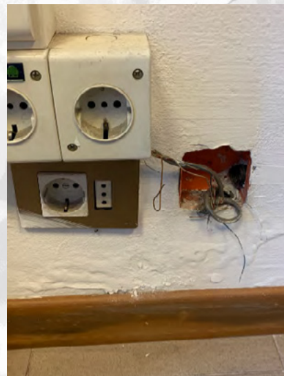
Tribunale di Roma aula di udienza penale