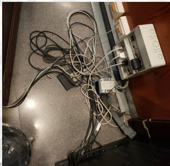
Tribunale di Biella aula di udienza