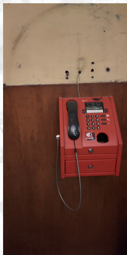
Tribunale di Biella corridoio