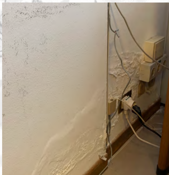
Tribunale di Roma aula di udienza penale