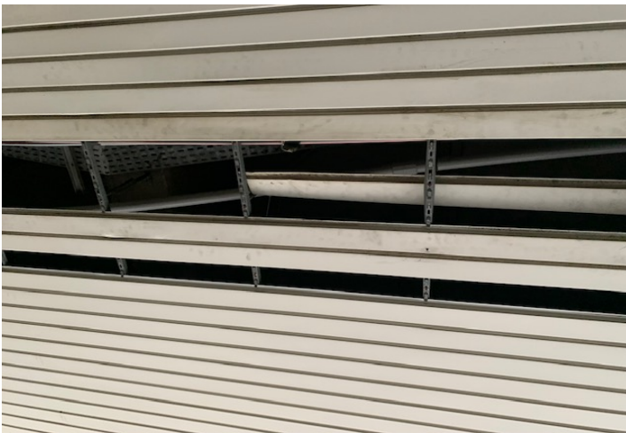
Fig. 24 e 25, particolare del soffitto dell'area circostante il cortile a piano terra.