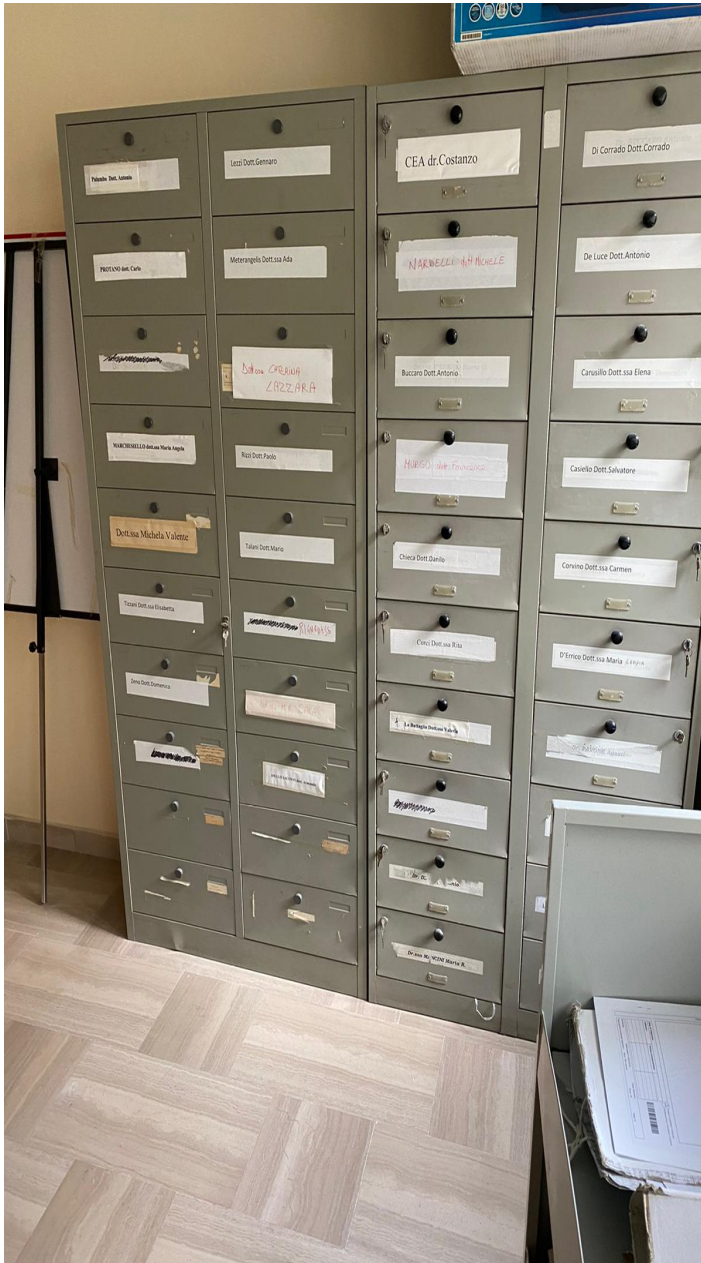
Fig. 6, particolare della stanza di cui alle due foto precedenti, assegnata a sette magistrati; stanza che ospita anche i cassetti di tutti i colleghi del Tribunale civile.