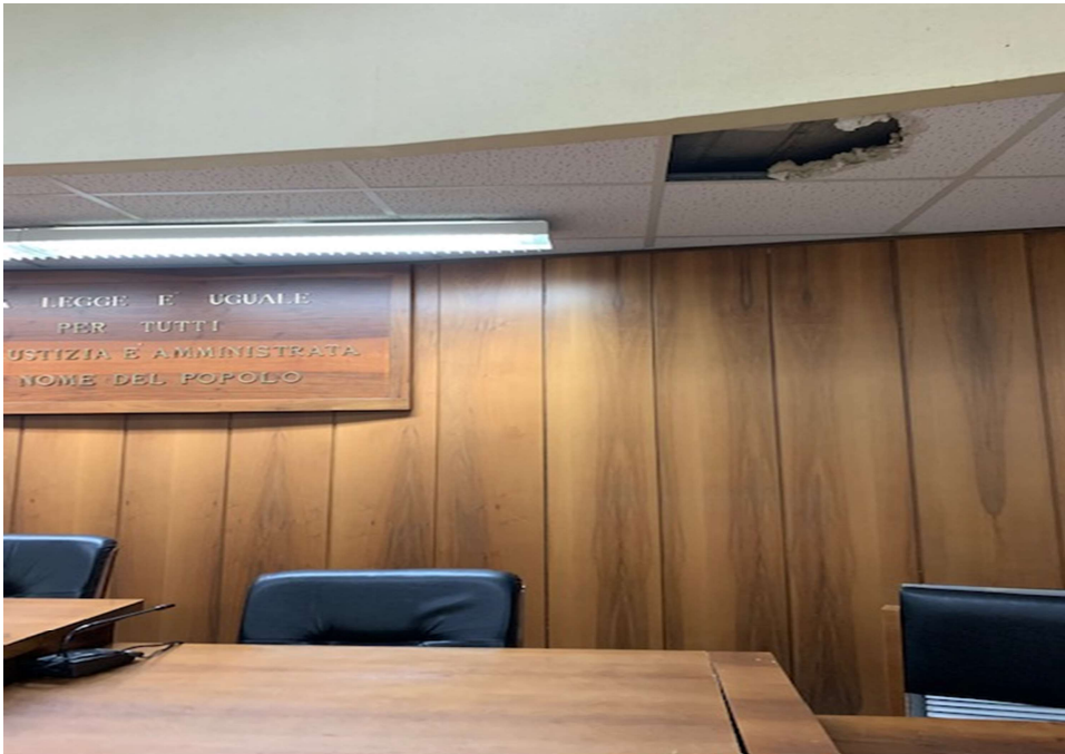
Fig. 16 e 17, Tribunale penale, primo piano, aula udienza n. 8, particolare del soffitto.