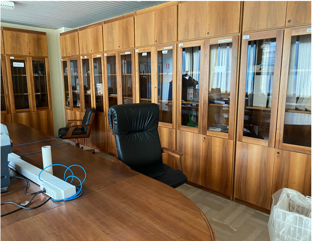
Fig. 5, particolare della stanza del Tribunale civile di cui alla foto precedente, assegnata a sette magistrati.