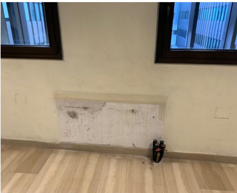
Fig. 21, secondo piano corridoio, particolare della parete.