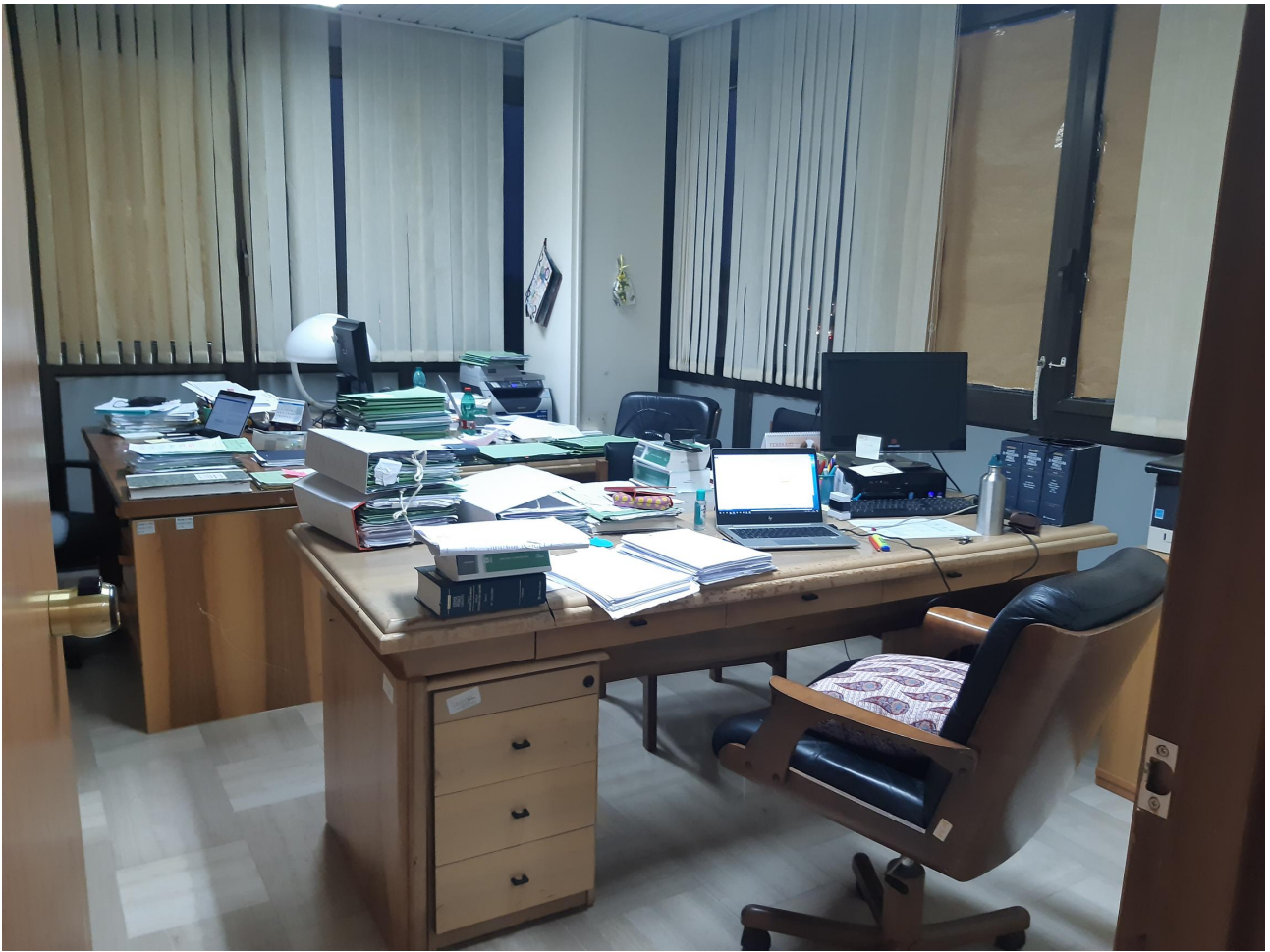
Fig. 12, particolare della stanza n. 238.