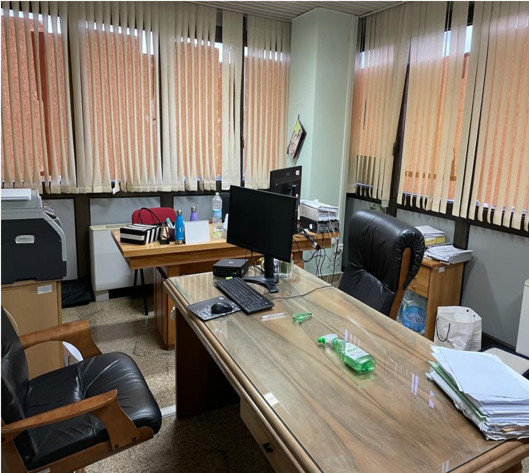
Fig. 13, Tribunale penale, stanza assegnata a 4 giudici, dotata di due scrivanie e due computer. Ai giudici sono affidati anche alcuni tirocinanti che dovrebbero potere usufruire della medesima stanza dell'affidatario.