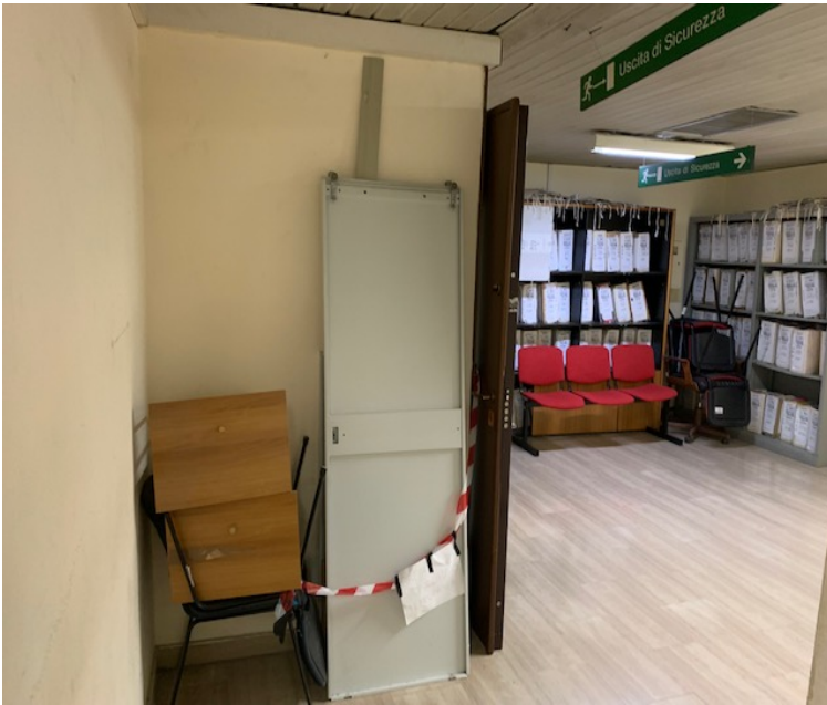
Fig. 20, primo piano, corridoio, spazio antistante un'aula d'udienza.