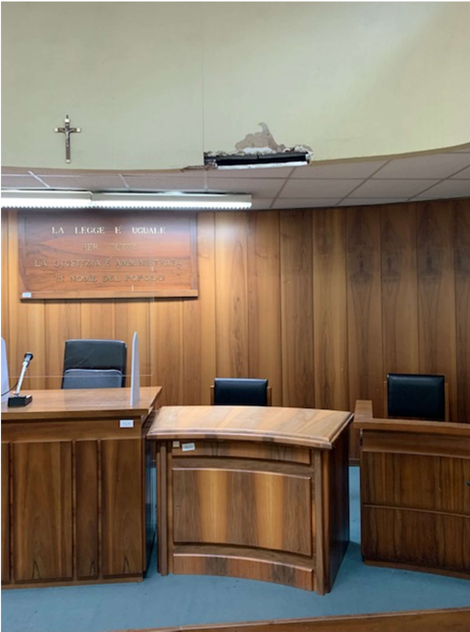
Fig. 14, Tribunale penale, primo piano aula udienza n. 7, particolare soffitto.