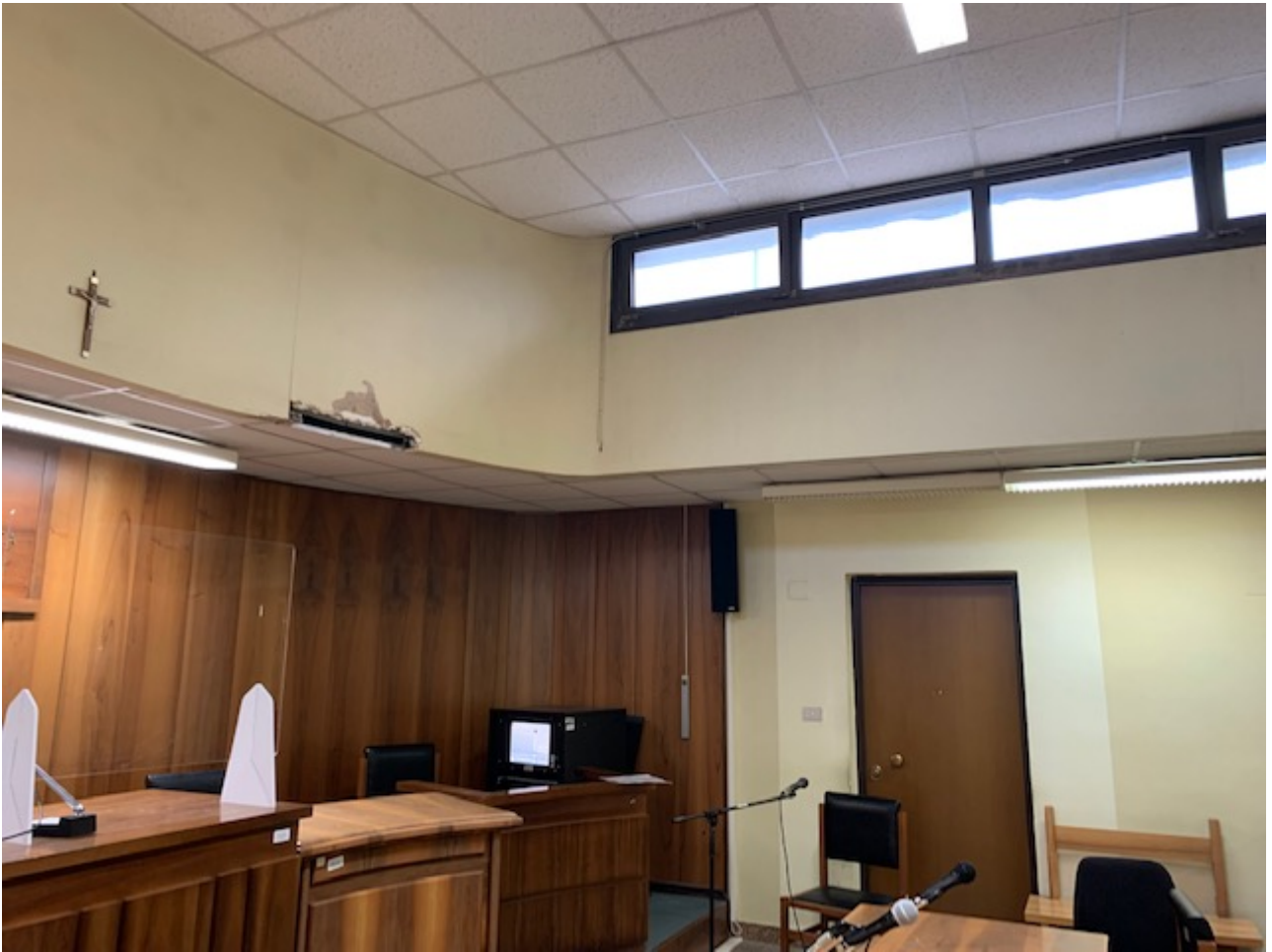
Fig. 15, Tribunale penale, primo piano, aula udienza n. 7; vasistas.