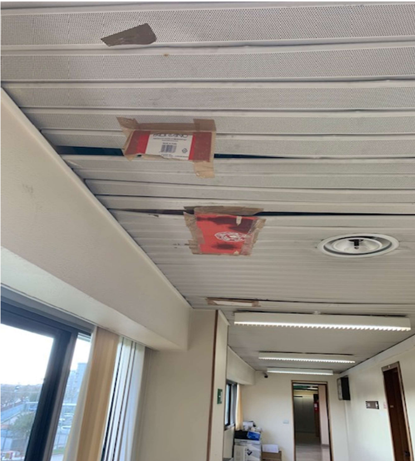
Fig. 19, Tribunale penale, corridoio che conduce alle aule d'udienza, particolare del soffitto.