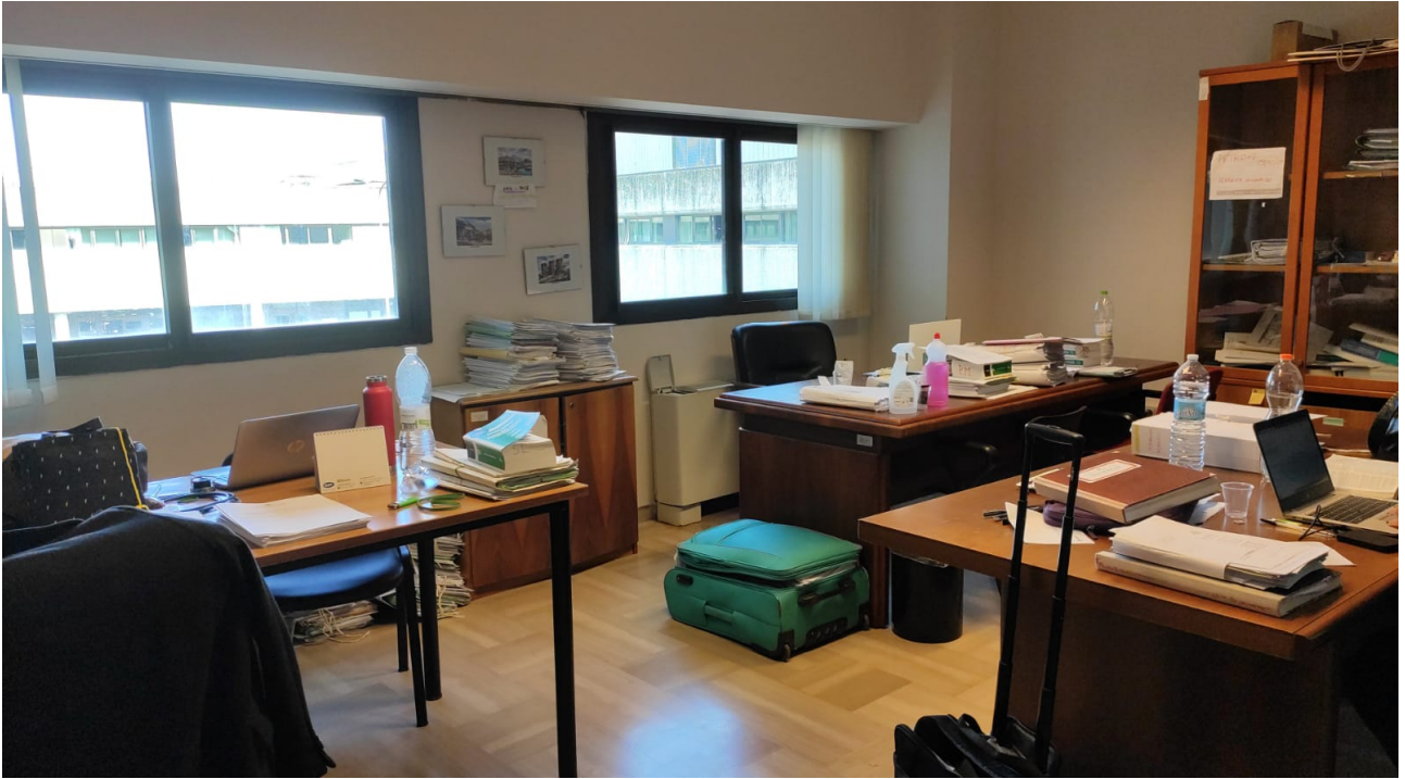
Fig. 3: primo piano, Tribunale penale di Foggia, stanza assegnata a quattro magistrati, giudici del dibattimento, dotata di tre scrivanie e di una sola postazione con computer fisso.