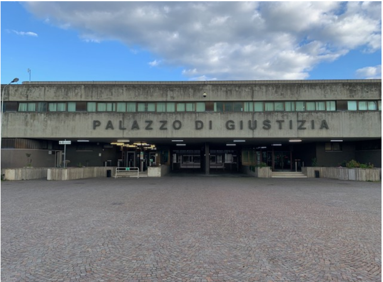
Fig. 1, Palazzo di Giustizia di Foggia, facciata principale, ingresso