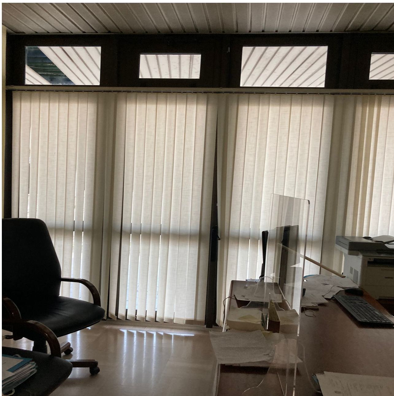
Fig. 8, Ufficio di sorveglianza – Foggia, particolare di una stanza; areazione garantita da vesistas al soffitto, nessun'altra areazione.