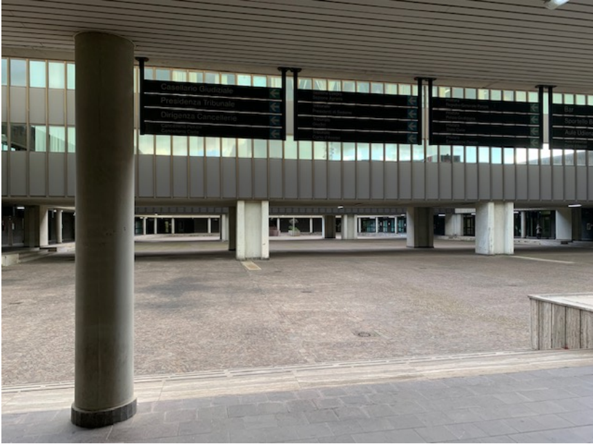
Fig. 23, cortile del Palazzo di Giustizia, piano terra.