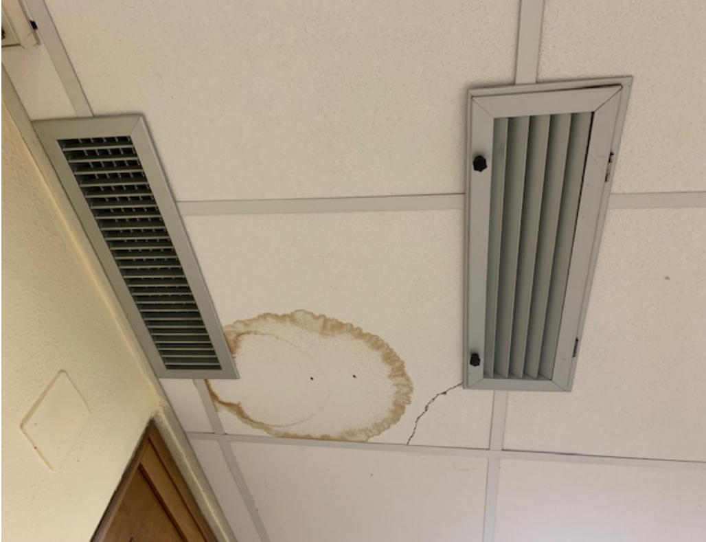
Fig. 22, Procura della Repubblica, corridoio, soffitto.