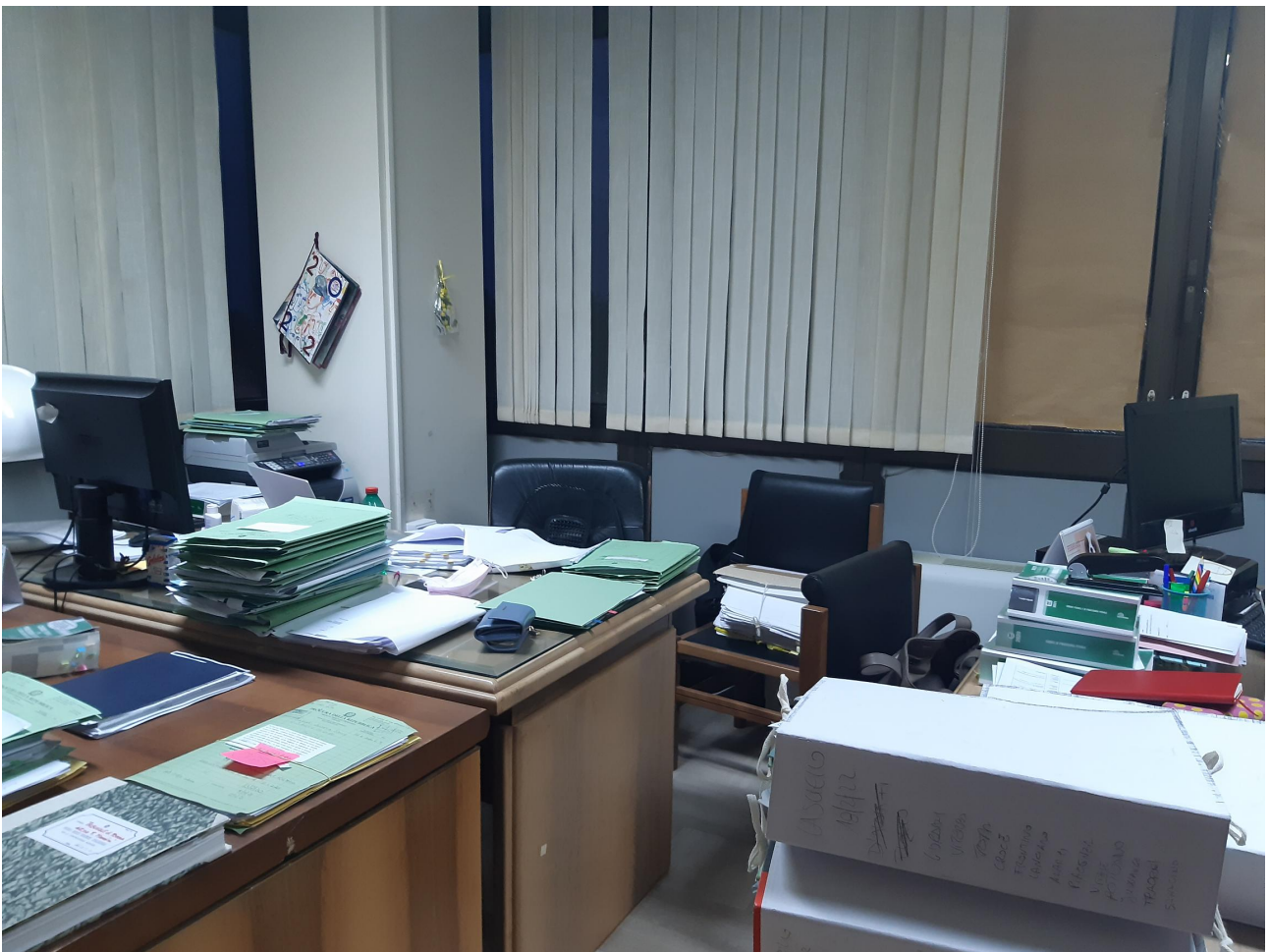
Fig. 10, Tribunale penale, secondo piano, stanza n. 238, assegnata a tre giudici della I e II sezione penale; su tre scrivanie, solo due sono dotate di PC fisso. La continua esposizione al sole e l'assenza di adeguata climatizzazione ha fatto registrare, all'interno della stanza, temperature di 40 gradi, da ultimo, nel periodo estivo del 2021, a partire dal mese di giugno.