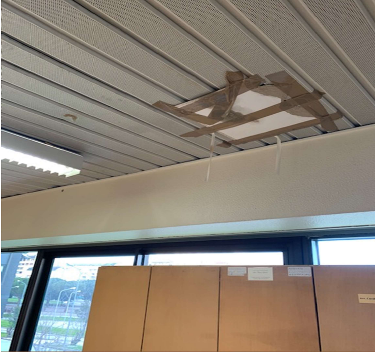
Fig. 18, Tribunale penale, corridoio che conduce alle aule d'udienza, particolare del soffitto.