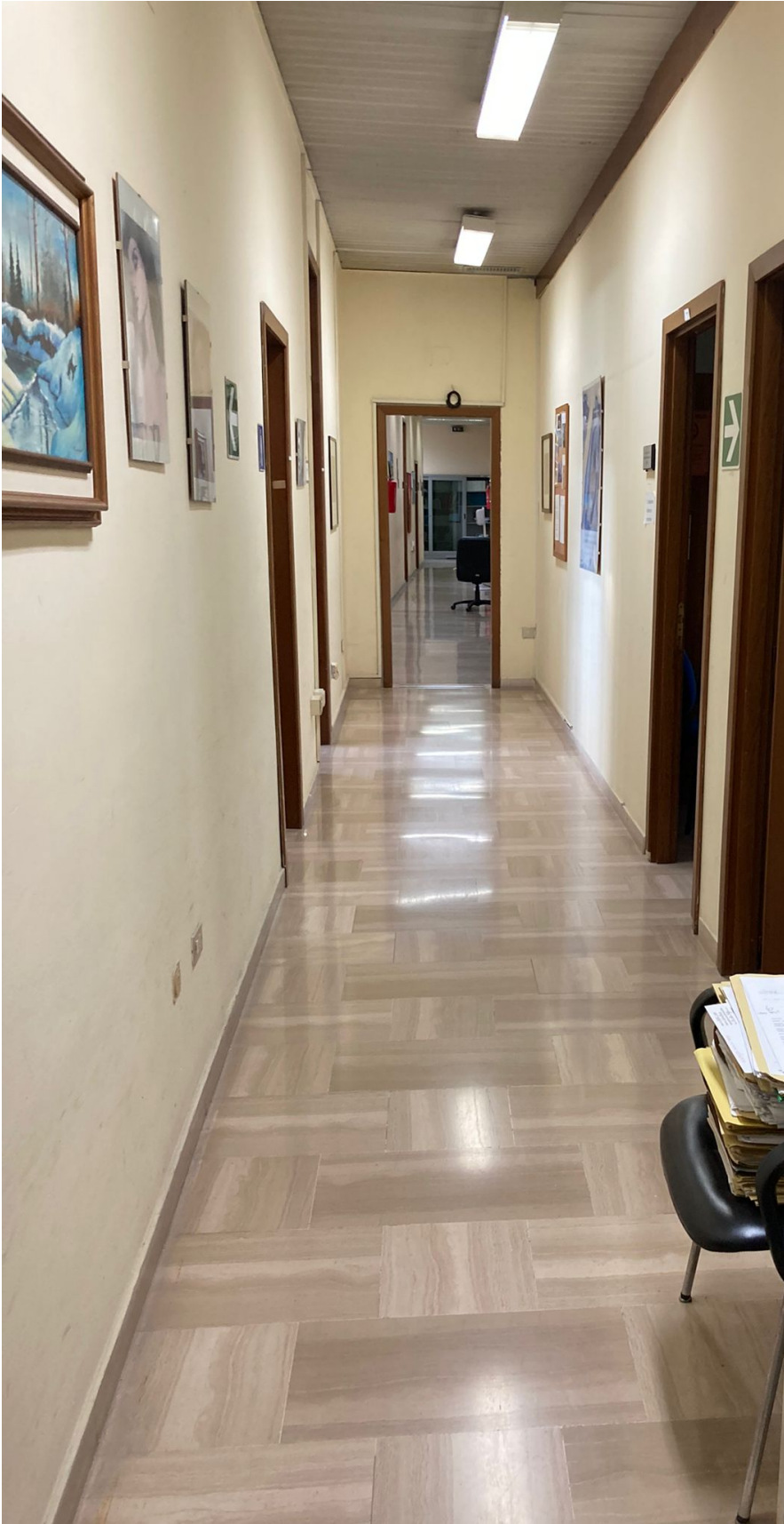
Fig. 7, Ufficio di sorveglianza - Foggia, particolare del corridoio.