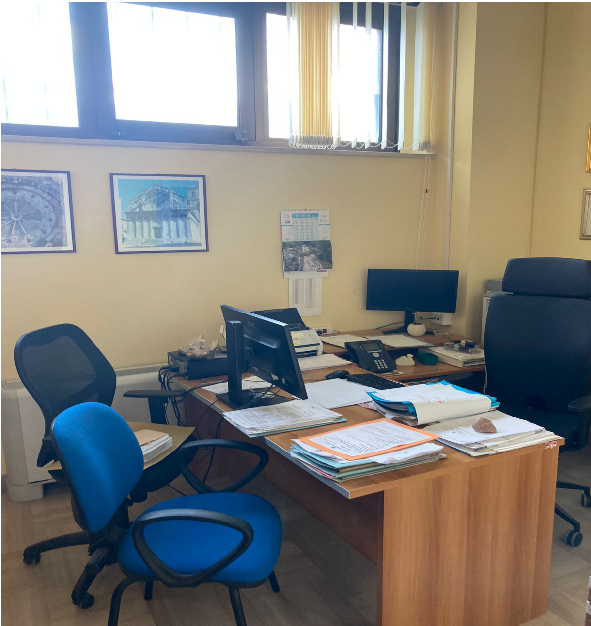
Fig. 9, Ufficio di sorveglianza – Foggia; particolare di una stanza.