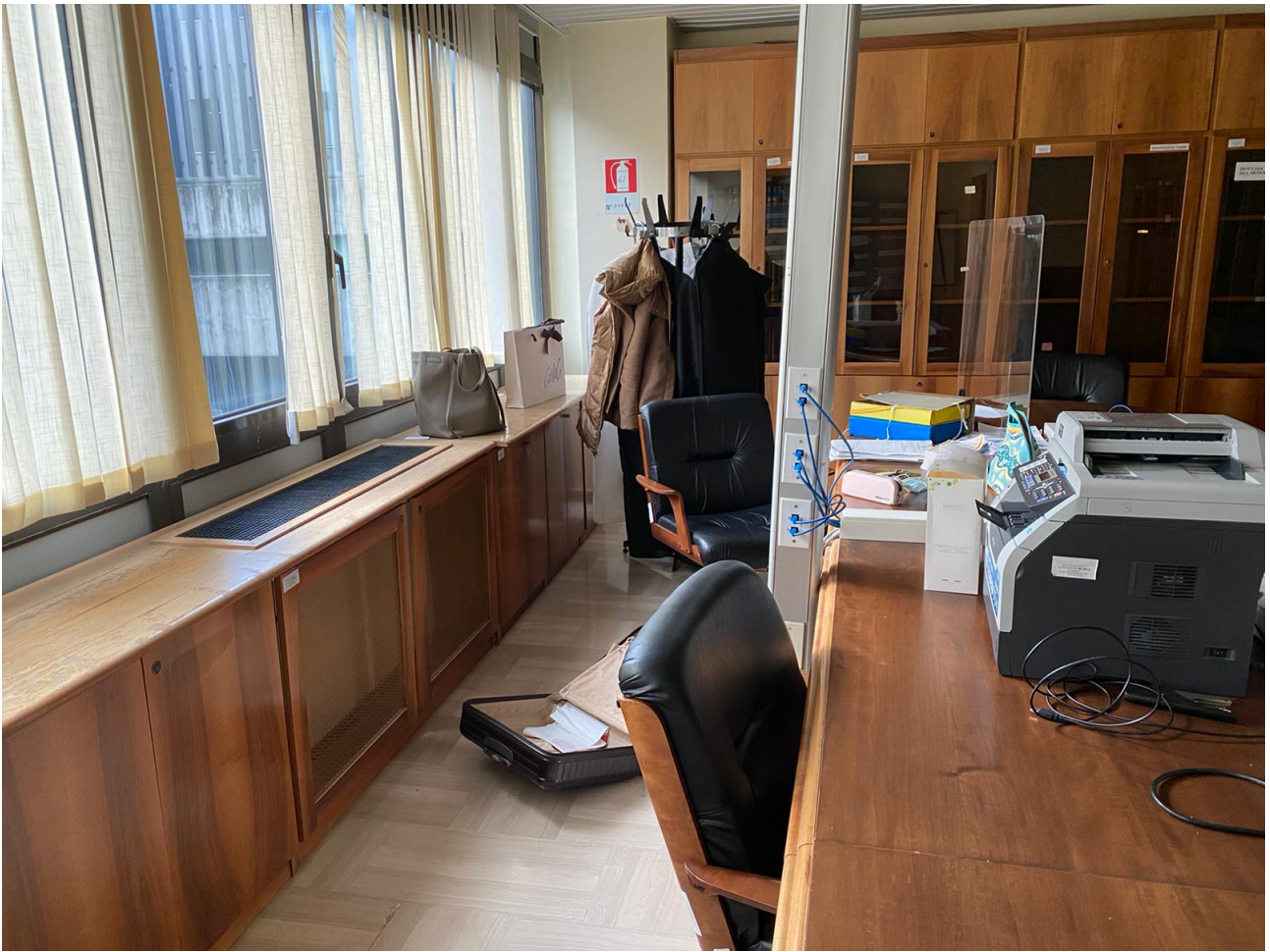
Fig. 4, Tribunale civile, particolare di una stanza assegnata a sette magistrati; la stanza non è dotata di computer né di telefono; non vi sono neppure distinte scrivanie per ciascun magistrato.