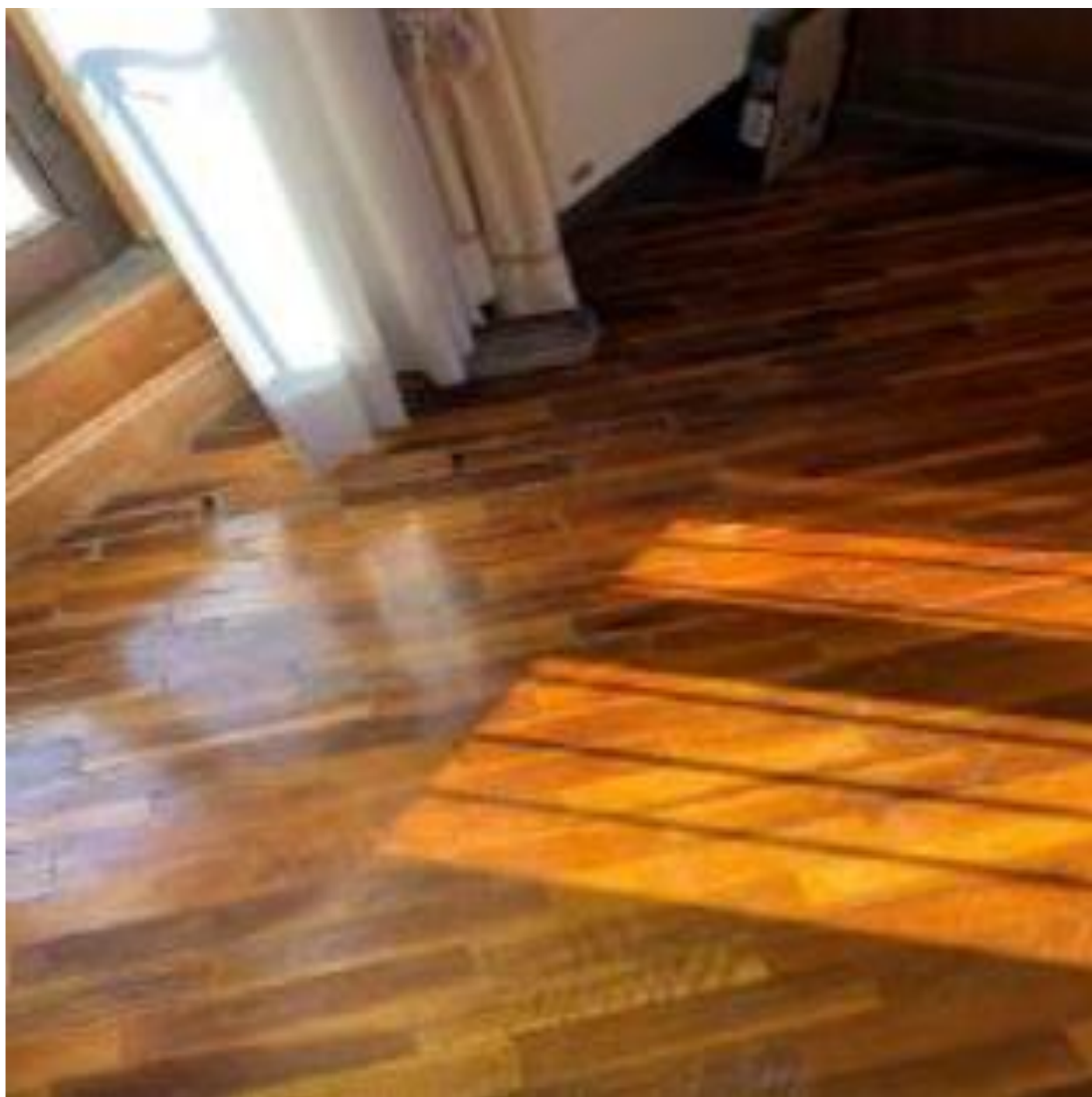
Pavimento divelto nelle stanze del personale amministrativo del piano 3.