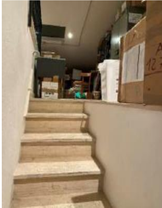
Parte superiore delle scale dell'archivio 1, mancante di parapetto; non conforme alla normativa antincendio.