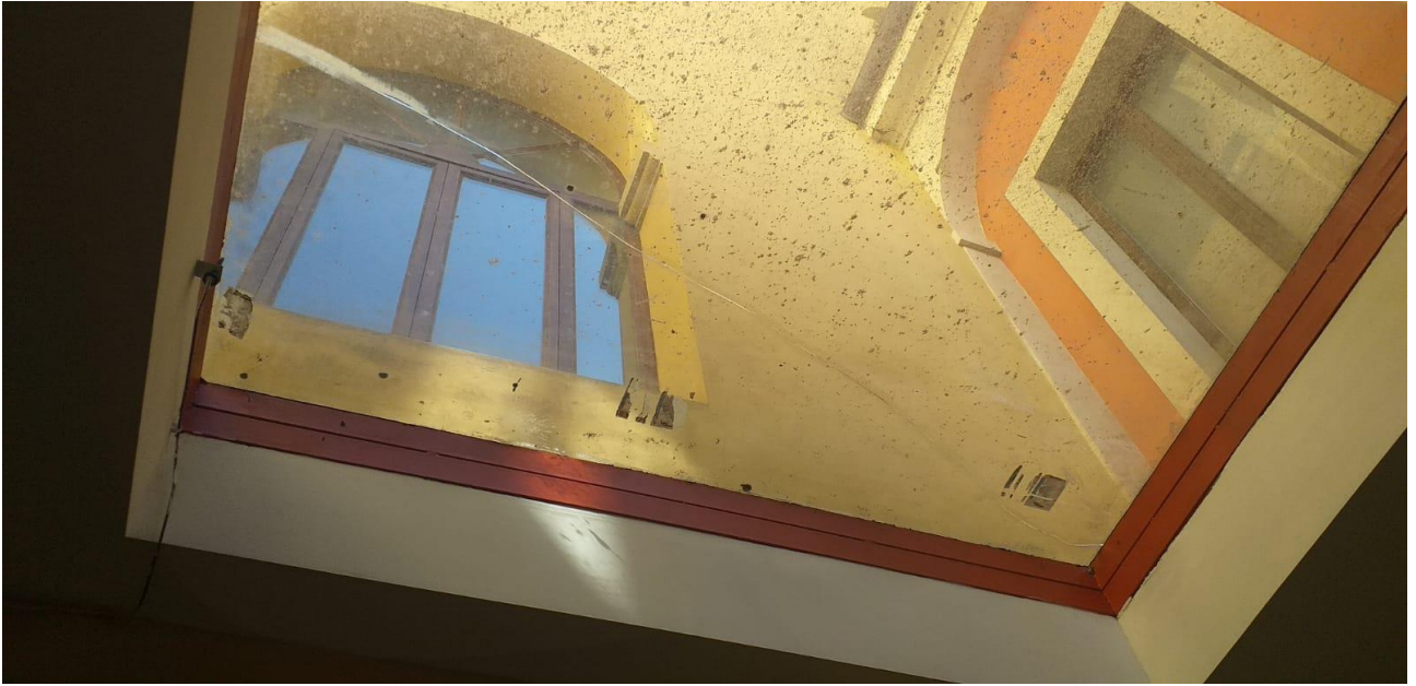
Vetrata incombente sulla aula di udienza del piano terra che presenta lesioni fessurative.