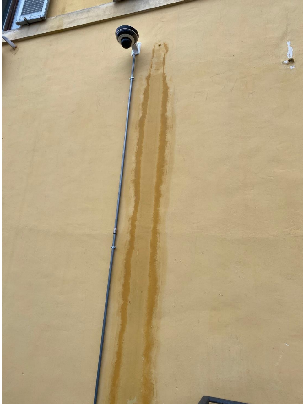
Percolamento di liquidi nella parete che si affaccia sul parcheggio