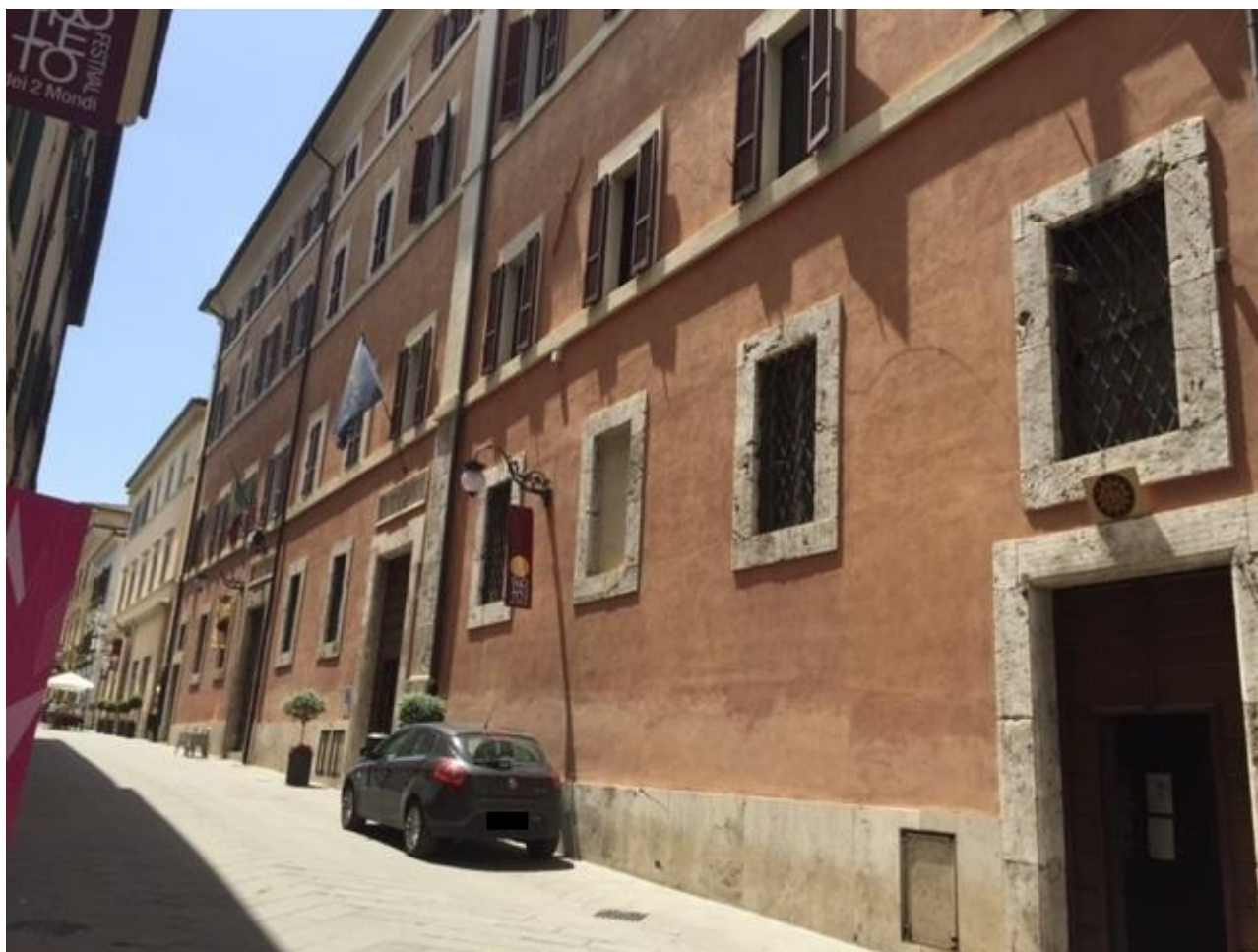
Facciata del Tribunale

Nella seguente relazione vengono brevemente riportate alcune delle criticità, le più evidenti, relative all'immobile che ospita il Tribunale di Spoleto. Nel dossier fotografico chiaramente si fa riferimento a fenomeni visibili, che attengono alla salubrità e sicurezza dei locali del Tribunale; ciò non toglie che le criticità riscontrabili nel suddetto edificio vanno ben oltre i sotto riportati fenomeni, riguardando principalmente anche l'idoneità e la sufficienza degli spazi disponibili per accogliere tutto il personale in servizio. Maggiori, e oserei dire quasi insormontabili, difficoltà si verificheranno quando, entro breve, prenderanno servizio 22 addetti all'Ufficio del Processo; il suddetto immobile non garantisce la predisposizione di postazioni fisse per gli stessi, sia per quanto riguarda i locali che per le prese internet ed elettriche.