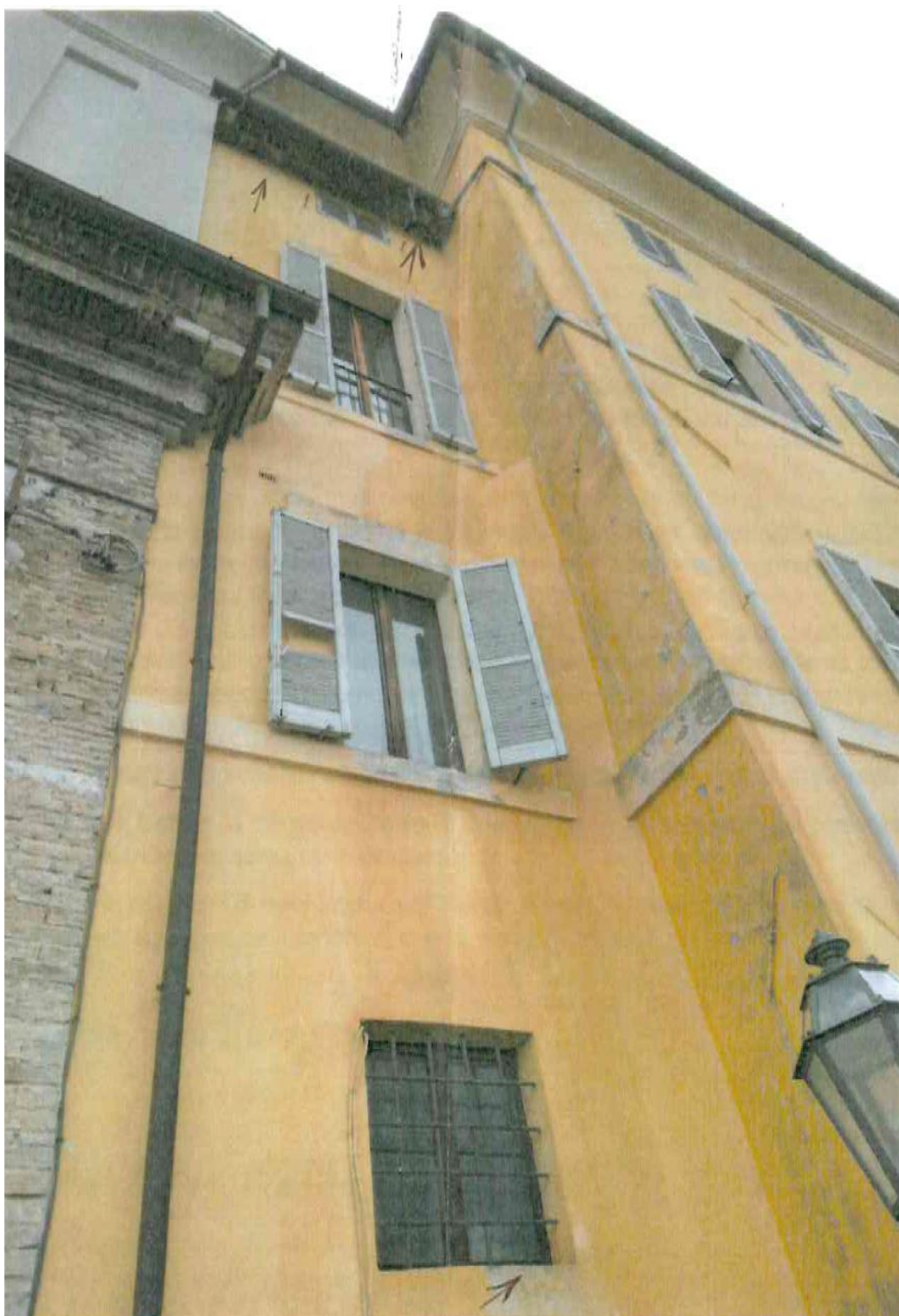
Lesione alla grondaia sotto la porzione di tetto che si affaccia sul parcheggio, la quale causa infiltrazioni su locali di servizio e sulla Sacrestia dell'adiacente chiesa di San Filippo.