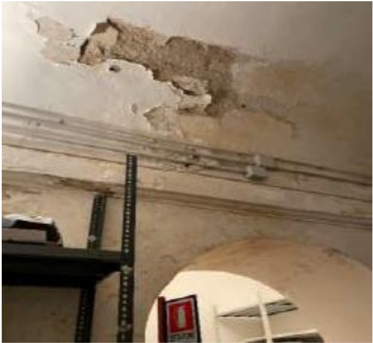
Importanti fenomeni di infiltrazione negli archivi e nella sala controllo posta al piano terra (in foto).